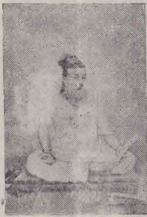
இன்று திருவள்ளுவர் திருநாள்

குல தருமத்தை வற்புறுத்தும் பகவத்கீதை மற்றும்