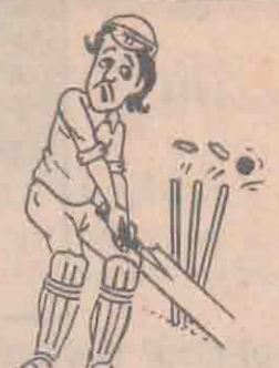
பொது மன்னிப்பு என்ற சொல்லுக்கே அர்த்தம் இல்லாமல் போகப்போகுது...!