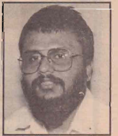
ஆகியும் - என்று கூறுகின்றார் டக்ளஸ். (12ஆம் பக்கம் பார்க்க)

கொழும்பு, பெப்.26 'எங்கள் அரசாங்கம்' விடுதலைப் புலிகளைப் பேசுக்கு அழைக்காது. - இப்படித் திட்டவாட்டமாகத் தெரி வித்திருக்கின்றார் ஈ.பி.டி.பி. செயலா ளர் நாயகமும் அமைச்சுமுனை டக் ளஸ் தேவானந்தா. தமிழகத்திலிருந்து வெளியாகும் 'துள்கா' சஞ்சிகைக்கு அளித்த பேட் டியிலேயே அவர் இப்படித் தெரிவித் திருக்கின்றார். பேச்சுக்களில் விடுபடும் இருப் பதுபேரால் பாசாங்கு செய்யும் விடு தலைப் புலிகள், தமது உண்மைச் சொரூபம் அம்பலமாக்காத மறைப் பதற்காகவே யுத்தநிறுத்தத்தை அறி விக்கின்றார்கள் என்று இந்தப் பேட் டியில் அமைச்சர் டக்ளஸ் புலிகள் மீது குற்றம் சுமத்தியுள்ளார். "விடுதலைப் புலிகளைப் பேச் சக்கு அழைக்கும் எண்ணம் ஏதும் அரசுக்கு இல்லாத போதிலும் அந் தகைய வாய்ப்புகள் குறித்து ஆராயப்படுவதாக வதந்திகள் உலரவு கின்றன. அவை உலகச் செய்திகளாகப் பரப்பப்படுகின்றன" - என்கின்றார் டக்ளஸ். கொழும்பு, பெப்.26 "பேச்சுக்கள் மூலம் புலிகளின் இரட்டைவேடம் அம்பலமாக்காதா?" - என்ற கேள்விக்கு மறுக்கும் பதிலை அளித்தார் அவர். "பேச்சு என்பது வெறுமனே ஏமாற்று வேலை; பாசாங்குச் செயல் நங்கள் கருவதுபோல பேச்சு என்றாலும் அடுத்தது என்ன? அரசாங்கம ஒரு யுத்தநிறுத்தத்தை அறிவித்தாலும், ஈழத்தில் எஞ்சியிருக்கின்ற சிறிய எண்ணிக்கையான இளைஞர் யுவதிகளும் மிரட்டியோ, மூளைச் சலவை செய்யப்பட்டுப் பலிக்கடாக கள் ஆக்கப்பட்டுவிடுவர். அவர்களுக்குத் தேவையான ஆயுதம் திரட்டப் பட்டதும் யுத்தம் மீண்டும் ஆரம்பம்