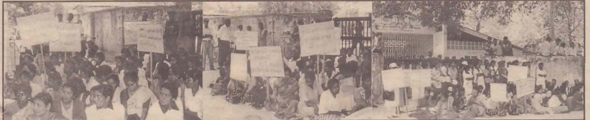
குடும்ப நல உதவியாளர்கள் சார்பில் நேற்று உண்ணாவிரதம் இருந்த போது எடுக்கப்பட்ட படங்கள்.