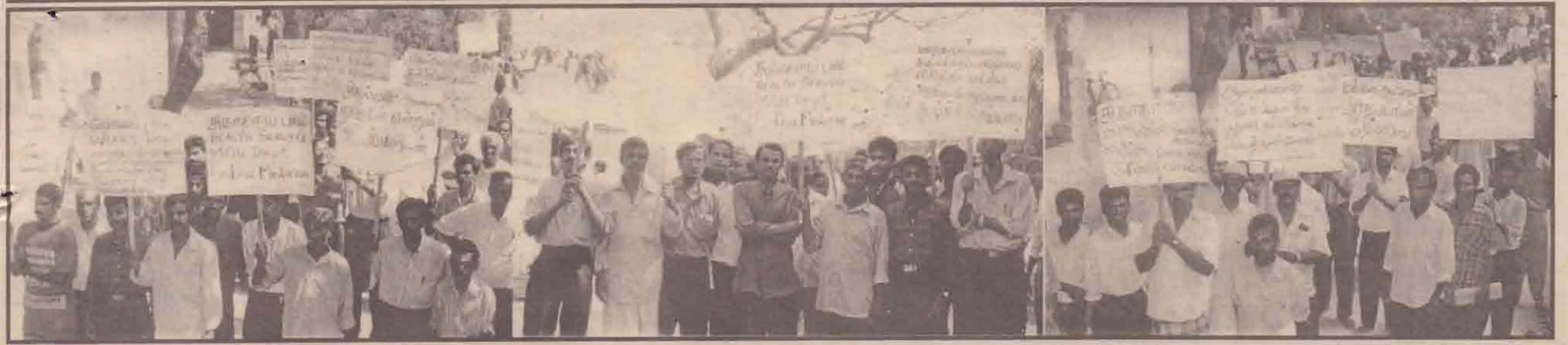
யாழ் மாநகர மேயருக்கும் நிர்வாகத்துக்கும் முழு ஆதரவும் நம்பிக்கையும் தெரிவித்து மாநகரசபை உறுப்பினர்கள் நடத்திய உள்வலத்தின் போது எடுக்கப்பட்ட படங்கள்.