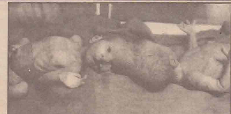
தலையால் ஓட்டிப் பிறந்த கிரட்டைக் குழந்தைகளை தனித்தனியாகப் பிரிக்க சிங்கப்பூரில் நடைபெற்ற சந்திரசீக்சை வெற்றிகரமாக முடிவடைந்துள்ளது. கடந்த ஆண்டு நேபாள மருத்துவமனையில் தலையால் ஓட்டிப்பிறந்த கிரட்டைக் குழந்தைகள் மருத்துவக் கண்காணிப்பில் கிருந்தபோது எடுக்கப்பட்ட படம். (விவரமான செய்தி 9ஆம் பக்கத்தில்)

இடம்பெயர்ந்த மக்களுக்கான மான்சு, ஏரல் மாதங்களுக்குரிய நிவாரணப் பொருள்கள் இன்னமும் வழங்கப்படவில்லை. பிரதேச செயலகங்களால் நிவாரண உள் உணவுப் பொருள்கள் பெற்றுக்கொள்வதற்கான 'பெர்மிட்' ரூகள் வழங்கப்பட்டபோதிலும், பல நோக்குக் கூட்டுறவுச் சங்கங்களுக்கு பருப்பு, பால்மா ஆகியவை கிடைக்காததால் பொருள்களை விநியோகிக்க முடியாத நிலை ஏற்பட்டுள்ளது. சித்திரைப் புத்தாண்டுக்கு முன்னர் நிவாரணப் பொருள்கள் வழங்க