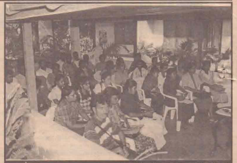
யாழ்ப்பாணம் கல்லூரி முறைசாராக் கல்விப்பீரடி நடத்தும் 'தேர்ப்பு' கற்கைநெறியைப் பின்பற்றுகின்ற மாணவர்களுக்கும் அண்மையில் 'உதயன்' அலுவலகத்துக்கு நேரில் வருகை தந்து, பத்திரிகை தயாரிப்பு பணியைப் பார்வையிட்டு பத்திரிகை உழியர்களுடன் கலந்துரையாடியது. 'உதயன்' அலுவலகத்துக்கு வருகை தந்த அந்த மாணவர் குழுவை படத்தில் காணலாம்.

வில்லை. பேச்சுத் தொடர்பான விடயங்களை இறுதிக்கட்டத்திலேயே எதிர்க்கட்சிகளுக்குத் தெரியப்படுத்த வேண்டும். இன்றுள்ள நிலையில் பேச்சு ஆரம்பிப்பது தொடர்பாக எவரும் குழப்பமடையத் தேவையில்லை. பேச்சு ஆரம்பிப்பதற்கு முன்னர் அது தொடர்பான விவரங்கள் வெளியிடப்படும் - என்று அமைச்சர் மேலும் தெரிவித்தார். (ஐ-3)