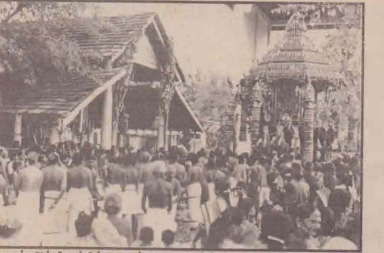
யாழ். அத்தியாயப்பிள்ளையார் ஆலய தேர்த்திருவிழா அண்மையில் கும்பேறது. தேர் கிழப்பிட்டுக்கை விட்டுக் கள்ளிய போது எடுக்கப்பட்ட படம் இது. (ம-9)