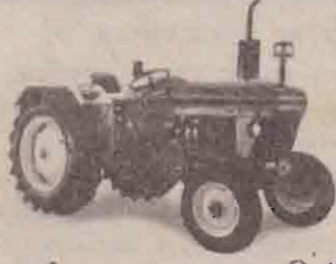
வலயச் சீட்டழப்பு - ஒரு உழவு இயந்திரம்