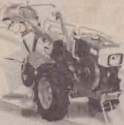
வலயச் சீட்டழப்பு - 5 கைஇயக்க உழவு இயந்திரங்கள்