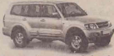
மாவரும் அதிர்ஷ்டச் சீட்டழப்பு - புத்தம்புதிய மாவரும் தீப்