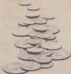
தினசரி - 12 தங்க நாணயங்கள் வலயச் சீட்டழப்பு - 10 தங்கநாணயங்கள்