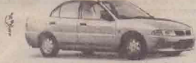
மாதம் - ஒரு புத்தம்புதிய மோட்டார் காள் (பெறமதி - 5.15 லட்சம்)