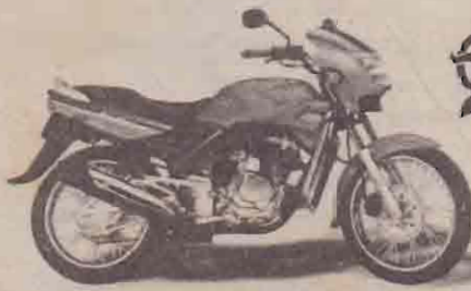
மாதம் - 5 மோட்டார் சைக்கிள்கள்