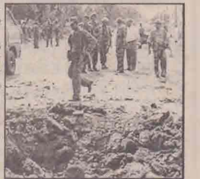
பம்பையடுவில் நேற்று கண்ணிவெடித் தாக்குதல் இடம்பெற்ற பகுதியில் எடுக்கப்பட்ட படம்.

கொல்லப்பட்டனர். நால்வர் காயமடைந்தனர். மூன்றாவது தாக்குதல் சம்பவம் கண்டிக்குளத்திலிருந்து பறையனாள்வளங்குளம் நோக்கிச் சென்று கொண்டிருந்த படையினரது வாகன அணி மீது நடத்தப்பட்டது. வாகன அணி மீது புலிகள் வெடிக் குண்டுகளை நடத்தியதில் ஏழு படையினர் கொல்லப்பட்டனர். பலர் காயமடைந்தனர். நேற்றைய தாக்குதல்களில் மொத்தம் 13 பேர் கொல்லப்பட்டும் 23 பேர் காயமடைந்தும் உள்ளதாக வவுனியா படை வட்டாரங்கள் தெரிவித்தன. எனினும் இத்தாக்குதல்கள் தொடர்பாக விசேட ஊடகத் தகவல் (14ஆம் பக்கம் பார்க்க)