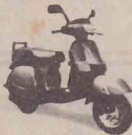
மாதம் - 5 ஸ்கூட்டர்கள்