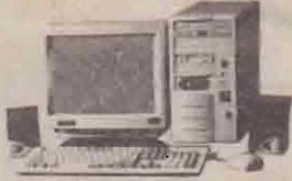
மாதம் - 3 கணனிகள்