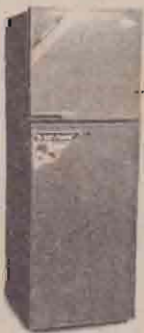
மாதம் - 5 குளிர்சாதனப் பெட்டிகள்