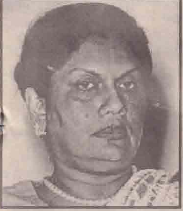
மக்களுக்கு ஆற்றிய உரையிலேயே அவர் இவ்வாறு வலியுறுத்தினார்.

நேற்று மாலை 'ரூபவாஹினி' தொலைக்காட்சி மூலம் நாட்டு