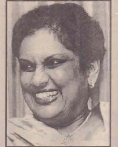
குமாரதாங்கவும் (ஜனாதிபதி) ஆட்சிப்பீடத்தில் இருக்கும்வரை எந்தவொரு சமாதான முயற்சியும் வெற்றி பெற வாய்ப்பில்லை' எனத் தெரிவித்திருந்தார். (8ஆம் பக்கம் பார்க்க)

தூரமான பின்னடைவுகளை உருவாக்கும். கடந்த வாரம் தமிழ் அரசியல் விமர்சகர் ஒருவர் வெளியிட்ட கருத்தின் முடிவில் 'கதிர்காமமும்,