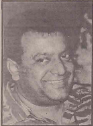
அரசு தீயானித்துள்ளதாக வெளியான செய்திகளை இதுவரை அரசு செய்திபுடக்கள் மறுதலிக்கவில்லை. கடைசியாக சொல்லெறும் சிறிலங்கா வந்தபோது அவருக்கு ஒரு புதிய அனுபவம் ஏற்பட்டது. அதாவது

எரிக் சொல்லெறும்மை சமாதான நடவடிக்கைகளில் இருந்து நீக்குவது என பொ.ஐ.முன்னணி