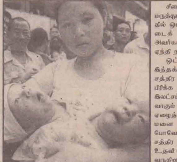
சீனாவின் சொங்க்யுவில் மருத்துவமனையில் சமீபத்தில் ஓட்டிப் பிறந்த கிரட்டைக் குழந்தைகளை அவர்களின் தாய் கையில் ஏந்தி நிற்கும் காட்சி.

கிஸ்டனில் அண்மைக் காலமாக வன்முறைகள் அதிகரித்ததையடுத்து சட்டவிரோத ஆயுதங்களை தேடிக்கொண்டும் நடவடிக்கையினைப் பாதுகாப்புப் படையினர் மேற்கொண்டனர். அப்போதே இந்தத் தும்பாக்கி மோதல்கள் இடம்பெற்றன. நிலைமை கட்டுக்கடங்காமல் போவதைப்படுத்து பிரதமர் பிஜே பீட்சன் தலைநகரில் அமைதியை ஏற்படுத்த இராணுவத்தினரை அழைத்துள்ளார். அத்துடன் பரவி வரும் மோதல்களைக் கட்டுப்படுத்த வெளிநாட்டு உதவிகளை நாடவுள்ளதாகவும் அவர் தெரிவித்தார். (ஏ-4)