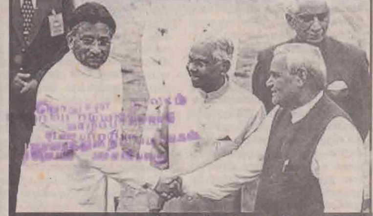
பாகீல்தான் இராணுவ ஆட்சியாளரும் அதிபருமான ஜெனரல் பர்வேஷ் முஷாரப் கிந்தியப் பிரதமர் வாஜ்பாயுடன் பேச்சு நடத்துவதற்காக நேற்று இந்தியா வந்து சேர்ந்தார். நேற்றுக் காலை ஜனாதிபதி மானிகயில் ஜெனரல் முஷாரப்புக்கு சம்பிரதாயபூர்வ வரவேற்பு அளிக்கப்பட்டது. பிரதமர் வாஜ்பாய் ஜெனரல் முஷாரப்பை கை குலுக்கி வரவேற்புகையும், அருகில் கிந்திய ஜனாதிபதி கே.ஆர்.நாராயணன், விவளிவகார அமைச்சர் ஸ்ரீலக்ஷ் சிங் ஆகியோர் மகிழ்ச்சியுடன் அவரை அணுகி கொண்டுவரவும் படத்தில் காணலாம்.