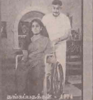
தங்கப்புகழை - 1974