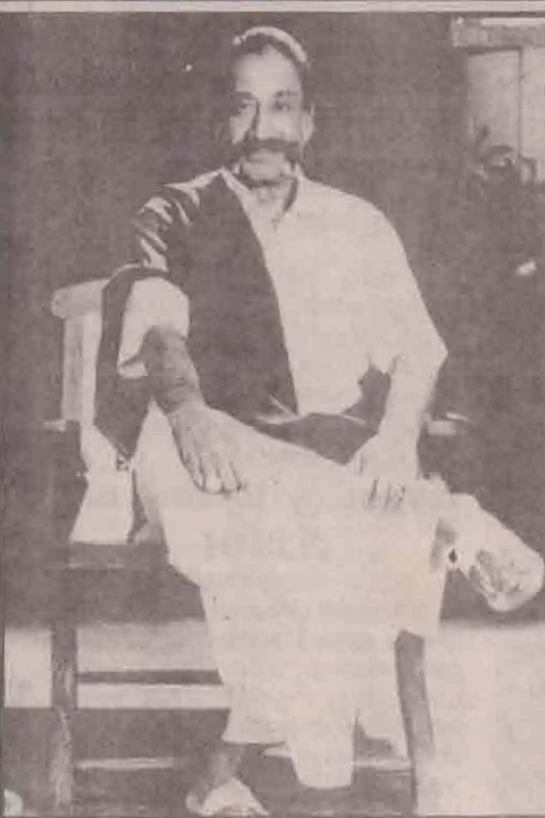
நவராத்திரி, மூன்று வேடங்களில் நடித்த 'தெய்வமகன்' என்பன பல திரைப்படக் கல்லூரிகளில் உட்களாக வைக்கப்பட்டுள்ளன.

ச.வே.ரா. பெரியார், "நான் இந்த மேடையில் வி.சி.கணேசன் என்ற நடிக்களைக் காணவில்லை, மராட்டிய