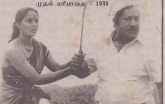
முதல் மரியாதை - 1985