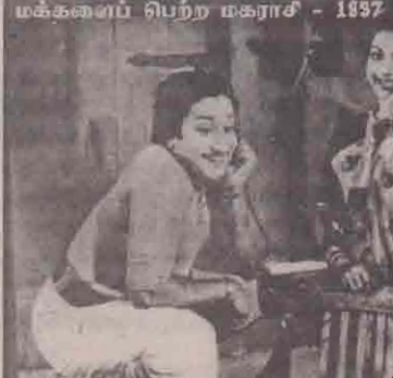
மக்களைப் பெற்ற மகராசி - 1857

"...எத்தனையோ வேடங்களை ஏற்று நடித்தும், தமிழ் சகுதாயத்தைச் சீர்திருத்திய பெரியார் வேடத்தை என்றேனும் ஒரு நாள் (12ஆம் பக்கம் பார்க்க)