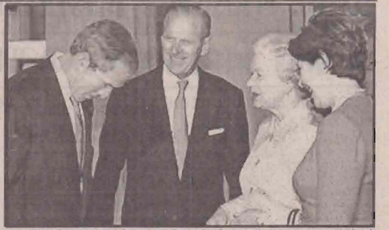
அமெரிக்க அதிபராகப் பதவியேற்ற பின்னர், முதல்தடவையாக, சமீபத்தில் பிரிட்டனுக்கு விஜயம் மேற்கொண்ட ஜோர்ஜ் டபிள்யூ. புஷ், பிரிட்டிஷ் மகாராணியாரை சந்தித்தபோது எடுத்த படம்.

்திரேலிய சட்டத்தரணிகளின் அமைப்புகள் உறுதிபடக் கூறியுள்ளன. உரிய முறையில் புகலிடம் கோரி விண்ணப்பிக்காதவர்களும், விஸாக் காலம் முடிவடைந்த பின்னரும் ஆஸ் திரேலியாவில் தொடர்ந்து தங்கியிருந்தவர்களும் கைது செய்யப்பட்டு தடுத்து வைக்கப்பட்டிருந்தபோது தப்பிச் சென்றுள்ளதாக ஆஸ்திரேலிய குடிவரவு, குடியகல்வு அதிகாரிகள் தெரிவித்தனர். (9)