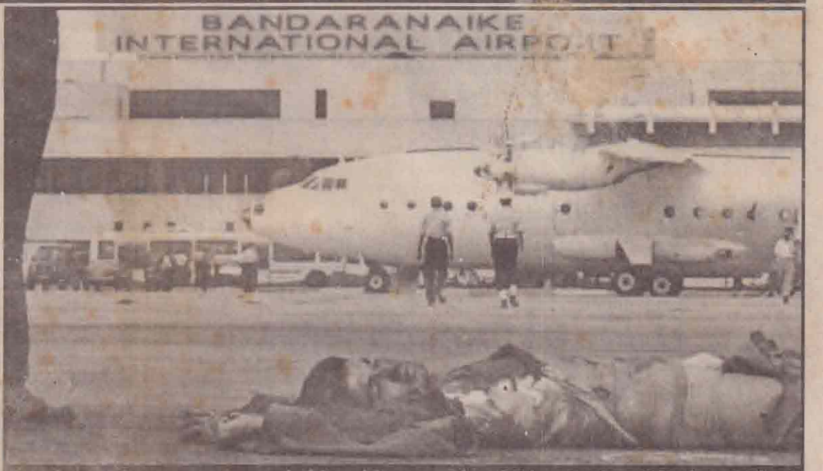
கட்டுநாயக்கா விமான நிலையத்தின் தார்ச்சாலையில் சூட்டுக்கு இலக்காகி கிறங்கி கிடக்கும் புலிகள் போராளி ஒருவர்.

கொழும்பு - நாகொழும்பு வீதியில் இருந்து விமானப்படைத் தளத்தை நோக்கிச் செல்லும் ஒரு கால்வாய் வழியாக முன்னேறிய அணி, விமானப்படைத் தளத்தின் முன்பில் அங்கு காவலில் இருந்த படையினர் மீது திடீர் தாக்குதலை நடத்தி, அனைத்துப் படையினரையும் கவனத்தையும் (14 ஆம் பக்கம் பார்க்க)