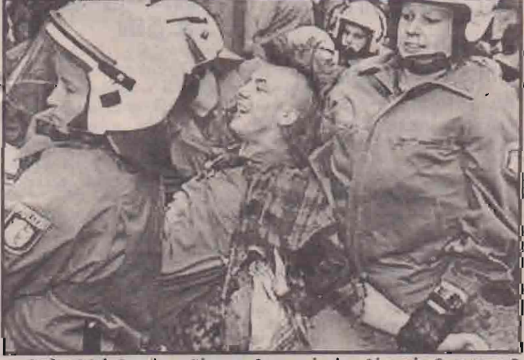
ஜெர்மனியின் பொன் நகரில் காலநிலை மாற்றம் குறித்த சர்வதேச மாநாடு கடைபிடித்த போது, ஆர்யாபாட்டத்தில் ஈடுபட்ட ஒருவரை பொலீஸார் அப்புறப்படுத்தும் காட்சி.