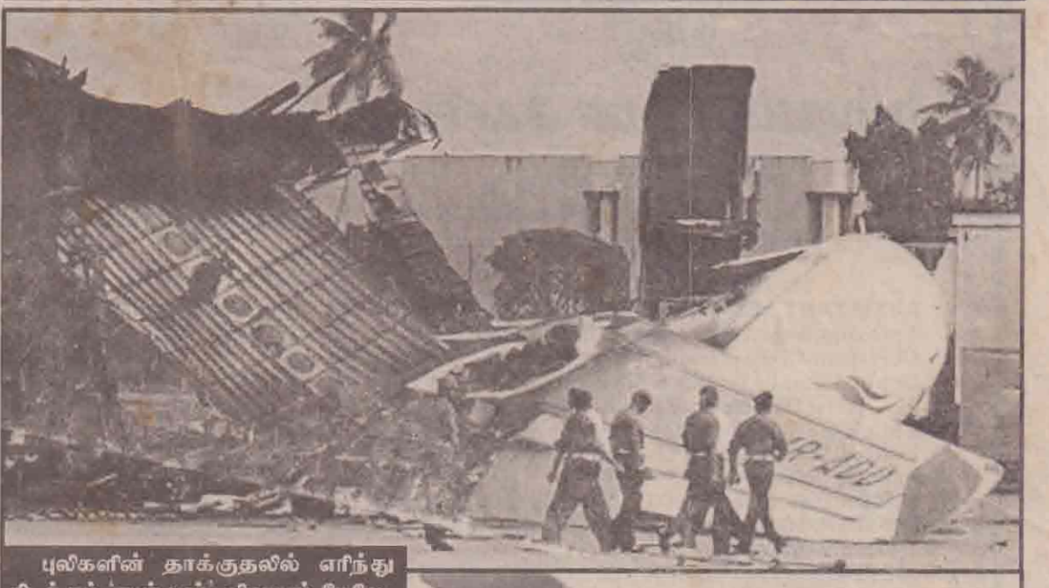
புலிகளின் தாக்குதலில் எரிந்து கிடக்கும் 'ஏயர் பஸ்' விமானம் மேலே, கிபிர் கீழே.

இந்த உற்சவத் திருவிழாக்கள் இன்று தொடக்கம் அடுத்தமாதம் 20ஆம் திகதி வரையும் நடைபெறவுள்ளன. அடுத்த மாதம் 3ஆம் திகதி மாலை 5மணிக்கு மஞ்சமும், 12ஆம் திகதி காத்திகை உற்சவமும், 13ஆம் திகதி கைலாச வாகனமும், 16ஆம் திகதி (14 ஆம் பக்கம் பார்க்க)