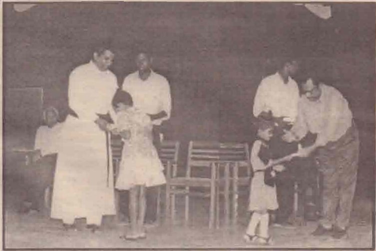
யாழ்.பல்கலைக்கழக மாணவர் ஒன்றியத்தினர், காணாமல் போன குடும்பங்களைச் சேர்ந்த சிறுவர்களுக்கு கைகொடுத்தல் நிதி வழங்கும் நிகழ்வு அண்மையில் இடம்பெற்றது.