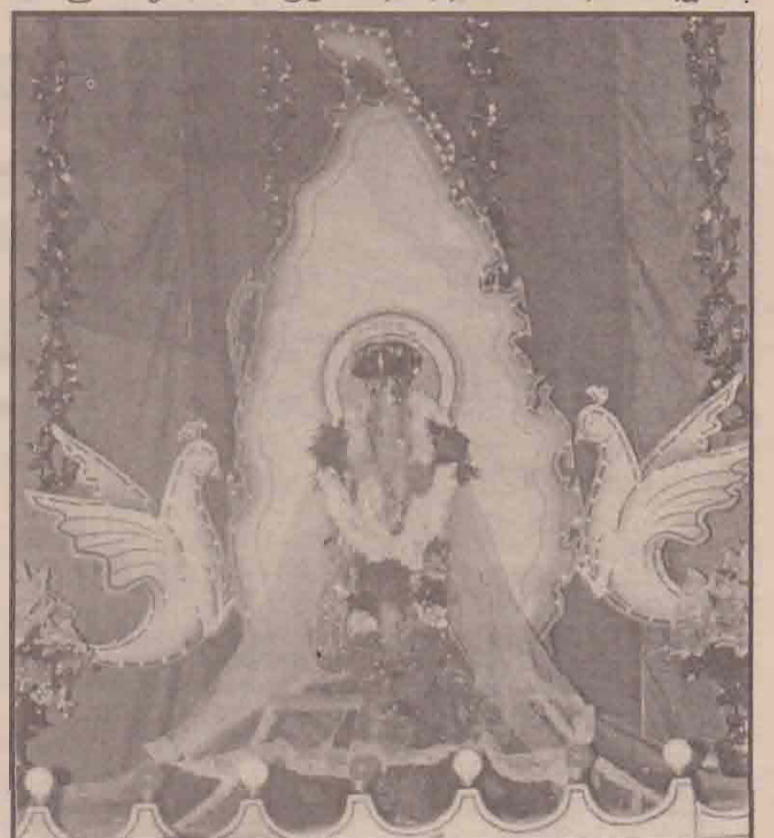
குருநகர் புகழமை மாதா ஆலயத்தின் வருடாந்தத் திருவிழா கடந்த 3ஆம் திகதி நடைபெற்றது. அன்று பக்தர்களின் தரிசனத்திற்காக ஊர்வலமாக எடுத்துவரப்பட்ட புகழமை மாதாவின் திருச் சொகுபத்தை படத்தில் காணலாம். (க-51)