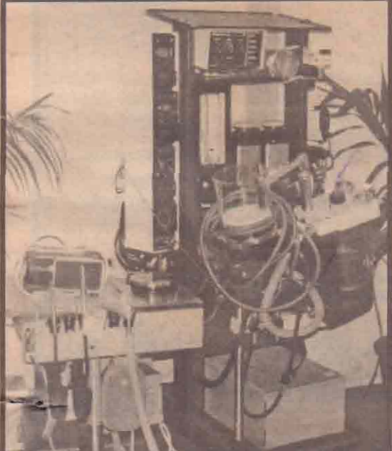
கிலங்கைக்கான அமெரிக்கத் தூதர் நேற்று யாழ்ப்பாணம் ஆஸ்பத்திரிக்கு அன்பளிப்புச் செய்த சுமார் 4 கோடி 20 லட்சம் ரூபா பெறுமதியான மருத்துவ உபகரணங்களைப் படத்தில் காணலாம்.

கொழும்பு, மார்ச் 7 விருதலைப் புலிகளுக்கும் அரசுக்கும் இடையிலான முதற்கட்ட நேரடிப் பேச்சு நெதர்லாந்து நாட்டின் தலைநகர் அம்ஸ்டர்டாமில் எதிர்வரும் சீத்திரைப் புத்தாண்டு காலத்தில் நடைபெறும் என்று தெரிவிக்கப்படுகிறது.