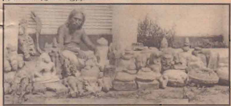
கலைப் பொக்கிஷங்களுடன் கலைஞர்

சிற்பங்கள் எனப்பலவும் கரையானுக்கு இலக்காகி அழிந்து போகும் நிலையில் பேணுவாரின்றிக் கிடக்கின்றன. ஏறத்தாழ 54 வருடங்களாகத் தன் வருமானம் முழுவதையும் தன் வாழ்நாள் முழுவதையும் அரும் பொருள்களைச் சேகரிப்பதற்காக அர்ப்பணித்துச் செலவிட்ட - சமுத தப்பாரம்பரியங்களைக் கண்டறிவதற்காகக் கால்கடுக்க நடந்து சிட்டுக்குருவி போல ஈழ நாட்டுக்கும் பறந்து