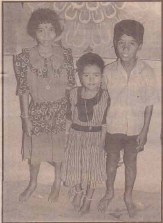
போரின் கொடிய கரங்களால் ஒரு கணத்தில் - ஒரே வேளையில் - பெற்றோரை கிழந்த குழந்தைகள்.