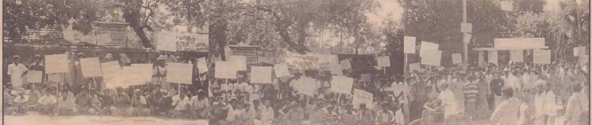
மீன்பிடிக்கும் நேரத்தையும் தூரத்தையும் அதிகரிக்குமாறும், கடலில் சுதந்திரமாகத் தொழில் செய்ய அனுமதிக்குமாறும் கோரி நேற்று வடமராட்சி கடற்றொழிலாளர்கள் மறியல் போராட்டத்தில் ஈடுபட்டனர். பருத்தித்துறை பிரதேச செயலகத்துக்கு முன்னால் கடற்றொழிலாளர்கள் திரண்டு வந்து ஆர்ப்பாட்டத்தில் ஈடுபட்டிருந்ததைப் படங்களில் காணலாம். (செய்தி மற்றும் படங்கள் உள்ளே). (க)

கொழும்பு, மார்ச் 20 நாகர்கோவிலுக்குத் தெற்கே அமைந்துள்ள விடுதலைப்புலிகளின் 'பங்கர்'களை கடந்த சனிக்கிழமை படையினர் தாக்கி அழித்துள்ளனர் என்று விசேட ஊடகத் தகவல் நிலையம் அறிவித்துள்ளது. சிறு அயுதங்கள் கொண்டு இந்தத் தாக்குதலைப் படையினர் மேற்கொண்டனர் என்றும் - இந்தத் தாக்குதலில் விடுதலைப் புலிகளின் ஆறு உறுப்பினர்கள் உயிரிழந்தனர் என்றும் - மூன்று படையினர் காயமடைந்தனர் என்றும் - தகவல் நிலையம் மேலும் தெரிவித்தது. நேற்று முன்தினம் அரிபாவை (12ஆம் பக்கம் பார்க்க)