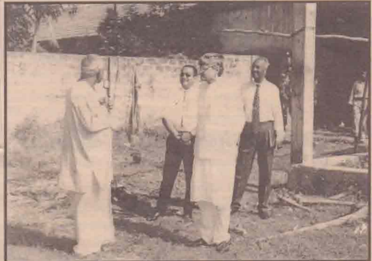
பருத்திக்குறையில் உள்ள ஸ்ரீ கிராமகிருஷ்ண சாரதா சேவாச் சிரமம் ரூபா 25 லட்சம் செலவில் கலாசாரமண்டபம் மற்றும் நூல் நிலையம் என்பவற்றை அமைத்து வருகின்றது.

மாண்புமாயப் பிரதேச சபை உற்சவ காலத்தில் 'புஷா' மூலம் குடிதண்ணீர் வழங்குவதற்கும், சுகாதார வசதிகளை மேற்கொள்வதற்கும் நடவடிக்கைகள் எடுத்துள்ளது. மேற்படி தீர்மானம் நேற்று முன்தினம் மருதடி விநாயகர் ஆலயத்தில் இடம்பெற்ற விசேட கூட்டத்தில் தீர்மானிக்கப்பட்டது. (ம-185)