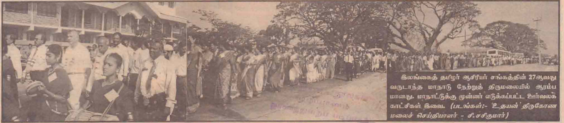
இலங்கைத் தமிழர் ஆசிரியர் சங்கத்தின் 27ஆவது வருடாந்த மாநாடு நேற்றுத் திருமலையில் ஆரம்பமானது. மாநாட்டுக்கு முன்னர் எடுக்கப்பட்ட உள்வலக் காட்சிகள் இவை.