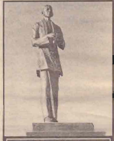
யாழ். நகரிலுள்ள தந்தையின் சிலை

தந்தையின் வாழ்க்கை வரலாறானது தமிழ்மக்களின் அபிவிருத்திகள் பல்வேறு கட்டங்களில் பெற்ற பரி