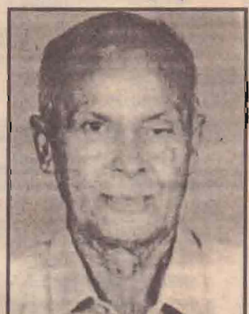
போதனாசிரியர் டிப்ளோமாப் பட்டம் பெற்று ஆசிரியரானார்.

தனது மேற்படிப்பைத் தொடர்வதற்காக 1958ஆம் ஆண்டு இந்தியா சென்ற இவர், உடற்கல்விப்