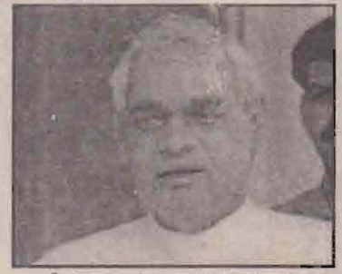
தானின் உண்மையான முகத்தை உலக நாடுகள் புரிந்துகொள்ள வேண்டும் - என்று தெரிவித்தார். (ஒ)

வலியுறுத்தி வருவதாகவும் - அதேசமயம் அத்தகைய நிலை ஏற்படும்வரை குறைந்தபட்ச அணு ஆயுதங்களை வைத்திருக்கும் இந்தியாவின் உரிமை நிலை நாட்டப்படவேண்டும் என்றும் தெரிவித்தார். முன்னதாக வாஜ்பாய் ஐ.நா. உச்சி மாநாட்டில் கலந்துகாண்டு உரையாற்றினார். அப்போது அவர், உள்நாட்டில் ஜனநாயகத்தை நசுக்கிவிட்டு, ஐ.நா.மாநாட்டு மேடையில் சுதந்திரம் பற்றி பாகிஸ்தானின் ராணுவ ஆட்சியாளர் விளக்கம் அளிக்கிறார். இதிலிருந்து பாகிஸ்தான்