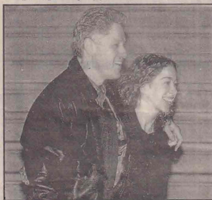
அமெரிக்க அதிபர் கிளிண்டன் மகன் செல்ஸாவும் மகிழ்ச்சியான ஒரு தருணத்தில்....

மேற்காசியப் பிரச்சினைக்கு உடன்பாடு ஏற்படுத்த பலஸ்தீன மும், இஸ்ரேலும் செப்ரெம்பர் 13 ஆம் திகதி வரை காலநிர்ணயம் விதித்து நடத்தியபேச்சுவார்த்தைகள் தோல்வியில் முடிந்ததும் - அதனால் செப்ரெம்பர் 13 ஆம் திகதி சுதந்திர பலஸ்தீன தனிநாட்டை பிரகடனப்படுத்தப் போவதாக யசீர் அராபத் அறிவித்திருந்ததும் தெரிந்தவையே. (ஒ)