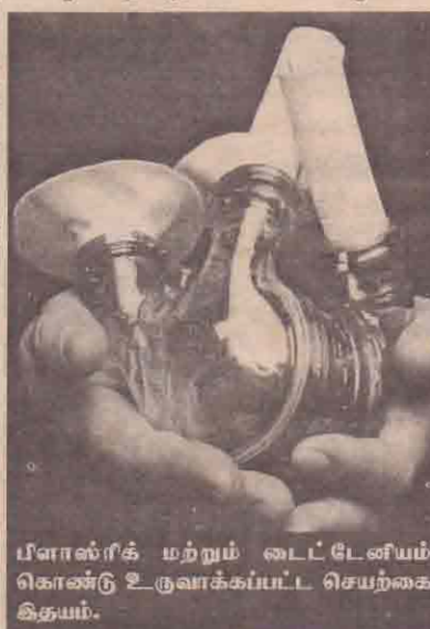
பிளாஸ்டிக் மற்றும் டைட்டேனியம் கொண்டு உருவாக்கப்பட்ட செயற்கை இதயம்.

சத்திரசிகிச்சை மூலம் நெஞ்சறைக் கூட்டினால் இந்த இதயத்தை பொருத்திவிட்டால் போதும் வெளியில் இருந்து அதனை இயக்கவேண்டிய தேவை இல்லை. இதயத்துடன் பொருத்தப்பட்ட பற்றியுடன் கூடிய மோட்டார் மூலம் 'பம்ப்' செயற்பாடு இடம்பெற்று குருதிச் சுழற்சியும் ஒழுங்குபடுத்தப்படுகின்றது. கடந்த பெப்ரவரி மாதம் இந்த செயற்கை இதயத்தின் வடிவமைப்பு முத்திரையிடப்பட்டது. பின்னர் மரணத் தறுவாயில் இருந்த பதினாறு இயை நோயாளிகளில் இது பரிசீலித்துப் பார்க்கப்பட்டது. அதன்பின்னர் கடந்த திங்களன்று நோயாளி ஒருவருக்கு இந்த இதயம் பொருத்தப்பட்டது. நோயாளியின் பெயர் விவரம் வெளியிடப்படவில்லை. இதற்கு முன்னரும் இரக்கும் தறுவாயில் இருந்த சில நோயாளிகளுக்கு செயற்கை இதயம் பொருத்தப்பட்டது. எனினும் அதன் மூலம் அவர்களது வாழ்நாள்களை சில நாட்களே நீடிக்க முடிந்தது. அத்துடன் அவை யாவும் வெளியில் இருந்த சில உபகரணங்கள் மூலம் இயங்க வைக்கப்பட்டன. இதனால் நோயாளி எந்த நேரமும் படுக்கையிலேயே இருக்கவேண்டும். ஆனால் தற்போது கண்டுபிடிக்கப்பட்டுள்ள இதயத்தினால் இவ்வாறான அசௌகரியங்கள் ஏதுவும் இல்லை. (ம)