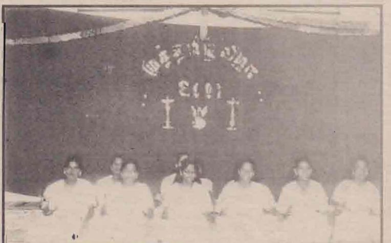
யாழ். சின்னேஜியல் மகளிர் பாடசாலையின் முத்தமிழ் விழா அண்மையில் நடைபெற்றது.

முத்தமிழ் விழாவில் ஓர் அங்கமாக நடைபெற்ற கிசை நிகழ்வு ஒன்றில் மாணவிகள் கலந்து கொண்டதைப் பட்டத்தில் காணலாம்.