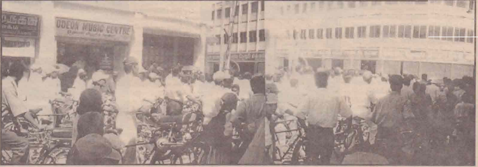
யாழ்.நகரப் பகுதியில் நேற்றுமுன்தினம் நடப்பகல்வேளை படையினர் பெரும் சோதனை நடவடிக்கை ஒன்றை மேற்கொண்டனர். பெரும் எடுப்பில் நடத்தப்பட்ட கிந்த நடவடிக்கையின் போது நகருக்குள் பிரவேசித்த வாகனங்களும் தடுத்து நிறுத்தப்பட்டு சோதனை செய்யப்பட்டன.

ஊழியர்களின் நன்மை கருதி இத்திட்டத்தை கட்டுறவுச் சங்கம் மேற்கொண்டுள்ளது. மாவட்ட வைத்தியசாலை ஊழியர்களுக்கு ஏற்கனவே 15 ஆண்கள் சைக்கிள் களையும் சங்கம் வழங்கியுள்ளது. (ஊ)