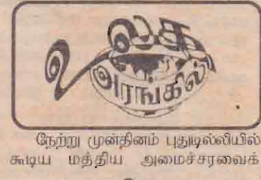
நேற்று முன்தினம் புதுடி, ஜூலை 6 - மத்திய அமைச்சரவைக்