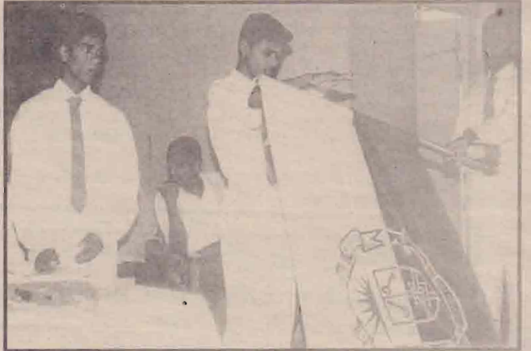
யாழ்.மத்திய கல்லூரியில் மாணவர் தலைவர்களுக்கான சின்னம் குட்டும் வைபவம் அண்மையில் நடைபெற்றது.

சின்னக் குட்டப்பட்ட மாணவர் தலைவர் ஒருவர் சீரேக்ட மாணவர் தலைவரின் முன் கல்லூரிக் கொடிக்கு மேல் சத்தியப்பிரமாணம் செய்து கொண்டுவதைப் பட்டத்தில் காணலாம்.