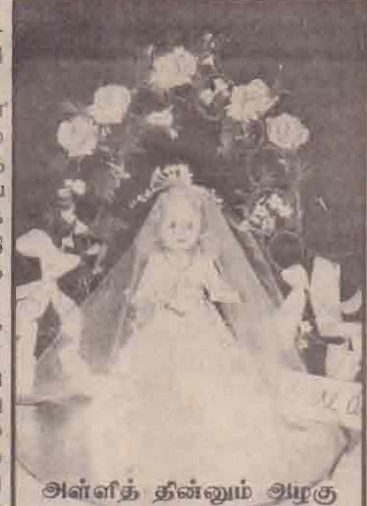
அள்ளித் தின்னும் அழகு