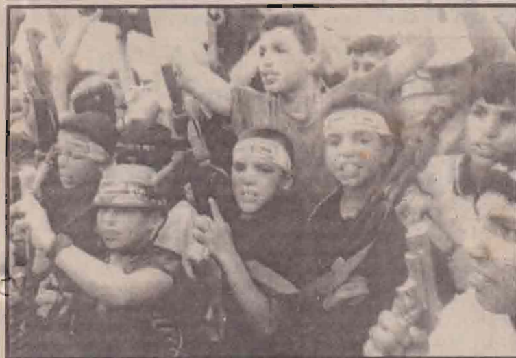
கிஸ்ரேலிய கிராணுவத்தால் ஆக்கிரமிக்கப்பட்டுள்ள பலஸ்தீன கேந்திர நிலையமான ஓரியண்ட் ஹவுஸ்லிருந்து கிஸ்ரேலியர்களை வெளியேற வற்புறுத்தி பலஸ்தீனச் சிறுவர்கள் சமீபத்தில் நடத்திய எழுச்சி ஆர்ப்பாட்டத்தில் ஒரு காட்சி கிது.