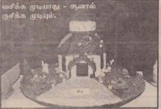
வசிக்க முடியாது - ஆனால் ருசிக்க முடியும்.

தேன் தேடி வந்த தேனிக்களை ஏமாற்றிய பூக்கள் - மடியில் தூக்கி வைத்துக் கொஞ்சத் தூண்டும் முயல் - இப்படிச் சொல்லிக் கொண்டே போகலாம். அத்தனைபும் மாச்சீன், மா, உணவு வண்ணம் என்பவற்றை இணைத்து, நங்களின் எண்ணங்களை உருவாக்கிய மாணவிகளின் கைவண்ணங்களே.