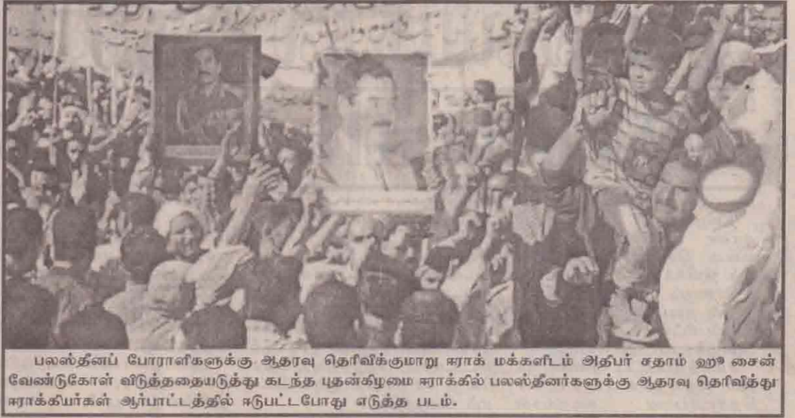
பலஸ்தீனப் போராடிகளுக்கு ஆதரவு தெரிவிக்குமாறு ஈராக் மக்களிடம் அதிபர் சதாம் ஹுசைன் வேண்டுகோள் விடுத்ததையடுத்து கடந்த புதன்கிழமை ஈராக்சில் பலஸ்தீனர்களுக்கு ஆதரவு தெரிவித்து ஈராக்சியர்கள் ஆர்பாட்டத்தில் ஈடுபட்டபோது எடுத்த படம்.

சுத்திணறி உயிரிழந்தனர். தீ ஏற்பட்டதற்கான காரணம் உடனடியாகத் தெரியவரவில்லை. நேற்று மாலைவரை உயிரிழந்த 68 பேரது சடலங்கள் மீட்கப்பட்டன. ஆயினும் உயிரிழந்தவர்களின் எண்ணிக்கை மேலும் அதிகரிக்கலாம் என்றும் அஞ்சப்படுகிறது. (ஒ)