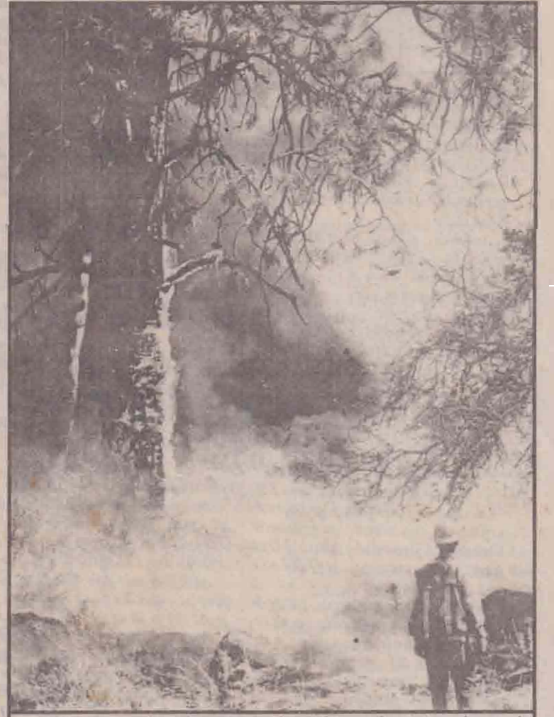
அமெரிக்காவின் பத்து மாநிலங்களின் வணிகப் பிரதேசங்களைப் பாத்ததுள்ள காட்டுத் தயிலால் சுமார் 500-க்கு 84 ஆயிரத்து 500 ஏக்கர்கள் பிரதேசம் சாம்பல் மோசியுள்ளது. சுமார் 21 ஆயிரம் தயிலைப்பு வீரர்கள் காட்டுத் தயிலை அணைக்கப் போராடி வருகிறார்கள். ஓராகப் பகுதியில் வானளாவக் கொண்டு விட்டபடியும் காட்டுத் தயிலைக் கண்டு தயிலைப்பு வீரர் ஒருவர் மலைக்குப்போய் தீர்ப்பைப் படத்தில் காணலாம்.

இதனால் ரஷ்யா போன்ற நாடுகள் சர்வதேச கண்காணிப்பாளர்கள் விடயத்தில் மெனம் சாதித்து வருகின்றன. பிரச்சினைக்குரிய பகுதிகளில் சர்வதேசக் கண்காணிப்பாளர்களை, அனுமதித்தால், தமது இராணுவம், பலஸ்தீனர்களுக்கு எதிராக நடத்தும் மனித உரிமை மீறல்கள் அட்பலமாகுமென இஸ்ரேல் அஞ்சுவதாக அரசியல் ஆய்வாளர்கள் கருதுகின்றனர். (ஏ-4)