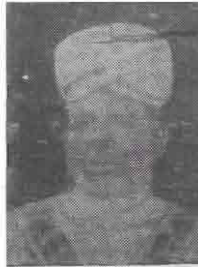
இராசவாசல் முதலியார் வீரவாகு சிற்றம்பலம்