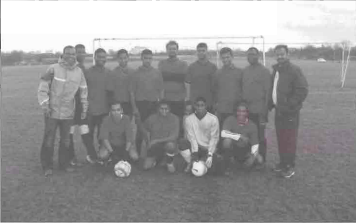
விக்னேஸ்வரா பழைய மாணவர்கள் கால்பந்தாட்டக்குழு