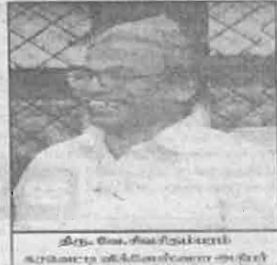
கர வெட்டி விக்னேஸ்வரக் கல்லூரி முதல்வர் கருமணி கல்வியாளர்