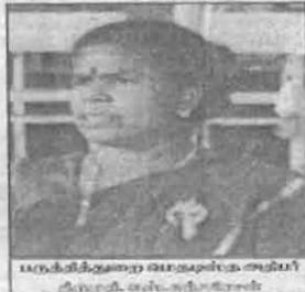
பருத்தித்தறை மெதடிக்கு ஆதிபரி கருமணி கல்வியாளர்