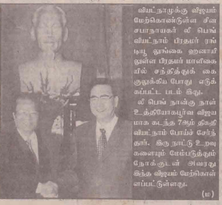
வியட்நாமுக்கு விஜயம் மேற்கொண்டுள்ள சீன சபாநாயகர் லீ பெங் வியட்நாம் பிரதமர் ராங் டியூ லூங்கை ஹனாய் லுள்ள பிரதமர் மாளிகையில் சந்தித்துக் கை குலுக்கிய போது எடுக்கப்பட்ட படம் கிது. லீ பெங் நான்கு நாள் உத்தியோகபூர்வ விஜயமாக கடந்த 7ஆம் திகதி வியட்நாம் போய்ச் சேர்ந்தார். இரு நாட்டு உறவுகளையும் மேம்படுத்தும் நோக்குடன் அவரது இந்த விஜயம் மேற்கொள்ளப்பட்டுள்ளது. (ம)

பொருள் கடத்தல்காரர்களே அதிகாரத்தில் உள்ளவர்களை நிர்ணயிக்கிறார்கள். அந்த நிலை பிலிப்பைன்ஸில் ஏற்பட இடமளிக்க முடியாது எனவே போதைவஸ்து வியாபாரத்தை ஒழிக்கும் நடவடிக்கையில் ஜனாதிபதி என்ற முறையில் எனக்குள்ள முழு அதிகாரங்களையும் நான் பயன்படுத்துவேன். என்று அந்த அறிக்கையில் தெரிவிக்கப்பட்டுள்ளது. (ம-9)