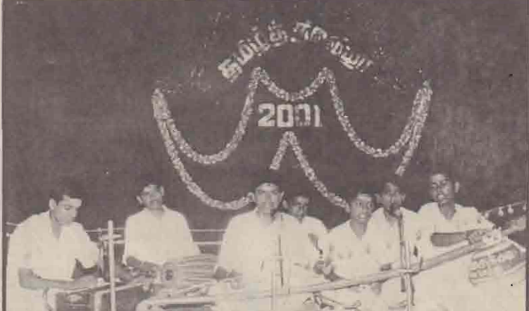
கொக்குவில் இந்துக் கல்லூரியில் அண்மையில் நடைபெற்ற தமிழ்த்தின விழாவில் மேற்படி கல்லூரி மாணவர்களால் நடத்தப்பட்ட வல்லுப்பாட்டு நிகழ்ச்சியைப் படத்தில் காண்கிறீர்கள்.