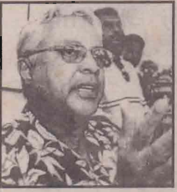
மையிலான அரசில் பங்கு கொள்ளும் என்று விடுக்கப்பட்ட அழைப்பை முன்னர் பிரதமர் மகேந்திர சௌத்தரி

கவா,செப்.11 பிஜியில் புதிய பிரதமராகப் பதவியேற்றுள்ள லெய்ஸனியா தலை