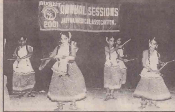
அனுபவமாக அமைந்தது முன்னொரு காலத்தில் கிராமப்புற ஆய்வாளர்களில் ஆடப்பட்ட இந்தக் கோலாட்டமரபு இன்று பெரிதும் ஆய்வாளர்களில் ஆடப்படுவதில்லை என்றே கூறவேண்டும். எனினும் இத்தகைய மருவிச் செல்

காரணமாக அந்த நோயைத் தங்குப் பரப்பியவர்கள் எனக் குறிப்பிடப்படுபவர்களை மர்மமான முறையில் கொலைசெய்துவிட்டு, இறுதியில் தம்