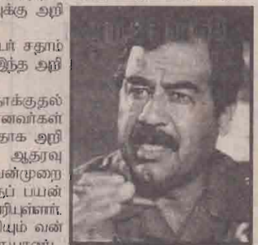
அமெரிக்காவுக்கு அறிவுரை கூறியுள்ளார் சராக் அதிபர் சதாம் ஹுசைன்.

இந்த நிலையிலாவது ஒரு தடவையேனும் அமெரிக்க அரசு நல்லறிவைப் பயன்படுத்தினால் அமெரிக்க மக்கள் நிம்மதி மூச்சு விடமுடியும் என்றார் அதிபர் சதாம். (சு)