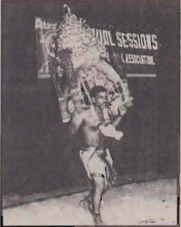
கலாசாரத்தைப் பேணிப் பாதுகாத்துக் கொள்ளமுடியும்.

தமிழர்களின் பூர்வீகக் கலைகள் பலவற்றுக்கும் புத்துயிர் அளிக்கப்பட வேண்டும். இதன் மூலமே தமிழர்