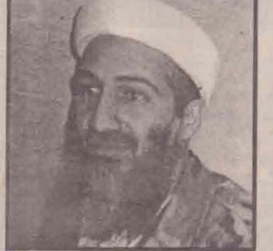
தற்காக பாக் - ஆப்கன் எல்லையை நோக்கிப் படை எடுத்து வருவதாக அங்கிருந்து வெளியாகும் தகவல்கள் தெரிவிக்கின்றன. (ஐ-9)

அமெரிக்கா விதித்தது நியூயார்க், செப்.17 சர்ச்சைக்குரிய இஸ்லாமியத் தீவிரவாதத் தலைவர் ஒஸாமா பின்லேடனை தாய்மீடும் ஒப்படைப்புக்கு முன்று நாள் அளவகாசத்தை தலிபான்களுக்கு அமெரிக்கா வழங்கி இருப்பதாக அறிவிக்கப்பட்டுள்ளது. இந்தக் கால அவகாசத்துக்குள் பின்லேடனை ஒப்படைக்கத் தவிரனால் அப்காணிஸ்தான் மீது தாக்குதல் நடத்தப்படும் என்றும் அமெரிக்கா எச்சரித்திருக்கிறது. கூந்த செல்வாயன்று அமெரிக்க நாடுகளின் மீது பெருந்த ஏடுப்பில் நடத்தப்பட்ட தற்கொலைத் தாக்குதல்களுக்கு தீவிரவாத ஒஸாமா பின்லேடனை பொறுப்பு என்று அமெரிக்கா குற்றஞ்சாட்டி இருக்கிறது. ஆனால் அதற்கான போதிய ஆதாரங்களைத்