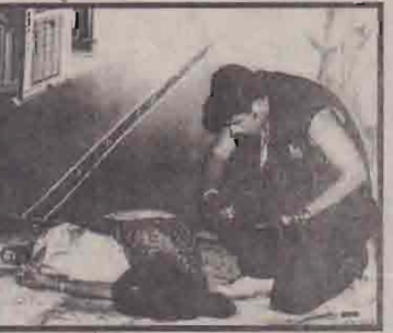
தனித்துவத்தை சீர்குலைவை வைத்ததைப்படி இங்கு குறிப்பிட்டே ஆகவேண்டும்.

கீதத்தைத் தொடர்ந்து மின்னணையில் ஏற்பட்ட கோளாறு, மேடை ஒழுங்கமைப்பில் ஏற்பட்ட தாமதம் என்பன காரணமாக நிகழ்வுகளை குறிப்பிட்ட நேரத்துக்கு ஆரம்பிக்கவோ, நிறைவு செய்யவோ முடியாது போயிற்று. மின்னணையில் ஏற்பட்ட கோளாறு நிகழ்வுகள் சிலவற்றின்