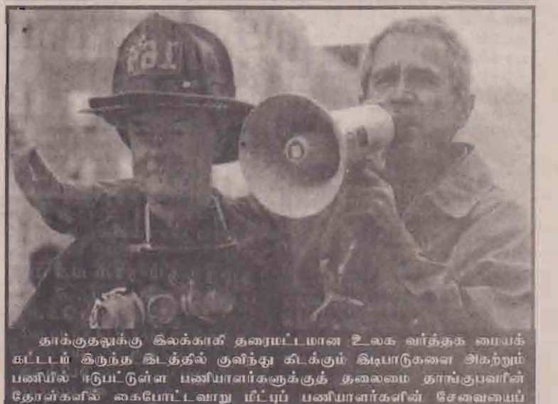
தாக்குதலுக்கு இலக்காகத் தரையடிமான உலக வார்த்தக மையக் கட்டடம் இருந்த கிடத்தில் குவிந்து கிடக்கும் இடிபாடுகளை அிகழும் பணியில் ஈடுபட்டுள்ள பணியாளர்களுக்குக் தகவலை தரங்குப்பவரின் தோள்களில் கைபோட்டவாறு மீட்புப் பணியாளர்களின் சேவையைப் பாராட்டிப் பேசுகிறார் அதிபர் புஷ்.