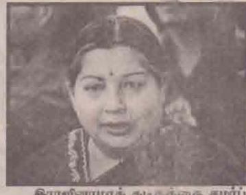
கிராஜினாயாக கடந்ததை சமர்ப்பித்தபின் ஆளுநர் மானுவலுக்கு முன் செப்திபாளர்களிடம் உரையாடியபோது, அடுத்த ஏழு ஆண்டுகளுக்குத் தேர்தலில் போட்டியிடத் தகுதியற்றவர் (2 ஆம் பக்கம் பார்க்க)

ராகப் பதவியேற்க தமிழக ஆளுநர் வழங்கிய அனுமதியே இந்திய அரசு மையு ஏற்பாடுகளுக்கு முன்னானது என்ற நேற்றைய தீர்ப்பில் இந்திய உயர் நீதிமன்றம் தெரிவித்தது. கிரிமினல் வழக்கு ஒன்றில் இரண்டு ஆண்டுகளுக்கு மேல் சிறைத் தண்டனை பெற்ற ஒருவர்,