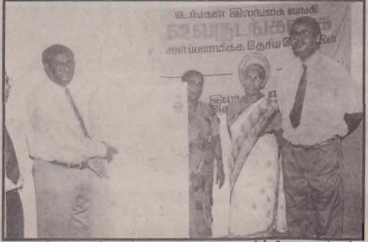
கிலங்கை வங்கியின் 62ஆவது வருட பூர்த்தியை முன்னிட்டு யாழ்ப்பாணம் கிலங்கை வங்கி உறுயர்களுள் யாழ்ப்பாணம் மருத்துவமனைக்கு அண்மையில் கிரு குளிர்சாதனப் பெட்டிகள் அன்பளிப்புச் செய்யப்பட்டன.