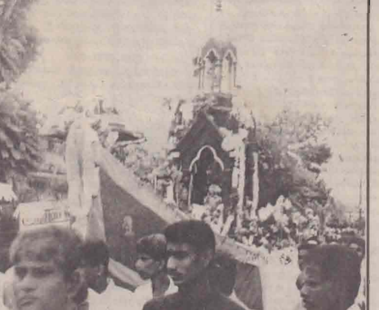
கன்னாகம் புனித அந்தோனியார் ஆலய வருடாந்த உற்சவம் அண்மையில் நடைபெற்றது. மீன்பிடிப்பகு போன்று அமைக்கப்பட்ட ஊர்தியில் திருச்சொருபம் பவன்வந்தபோது எடுக்கப்பட்ட படம். (ஐ-15)