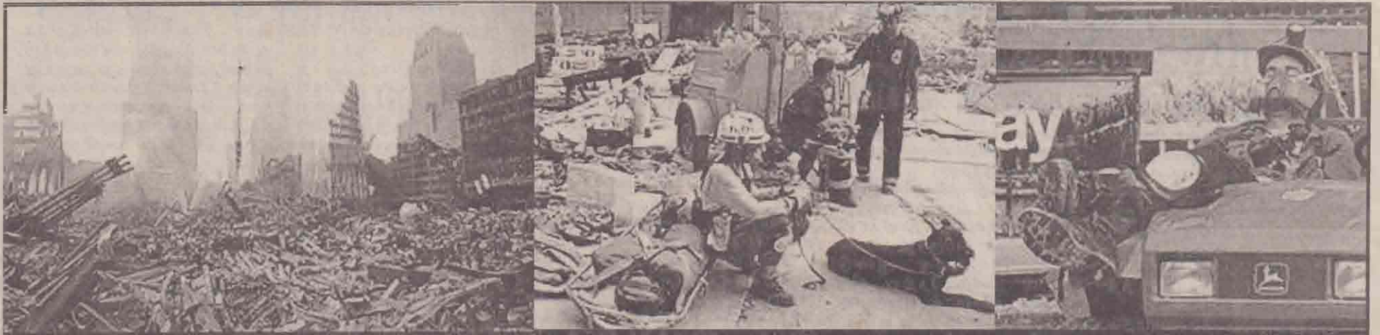
கடந்த 11 ஆம் திகதி கடத்தப்பட்ட விமானங்கள் முலம் தீவிரவாதிகள் தற்கொலைத் தாக்குதல் நடத்தி தரமட்டமாகிய உலக வர்த்தக மையக் கட்டடத்தின் கிழப்பாடுகள் கின்னமும் அகற்றப்பட்டு வருகின்றன. மலைபோல் குவிந்துள்ள, கின்னும் அகற்றப்படாத கிழப்பாடுகளை முதலாவது படத்தற்காணலாம். நீண்ட நாள் களாகத் தொடரும் இந்த மீட்புப் பணிகளில் ஈடுபட்டுள்ள பணியாளர்கள் மிகவும் களைப்படைந்து போயுள்ளனர். அவ்வாறு களைப்படைந்த பணியாளர்கள் சிலரும், கிழப்பாடுகளுக்குள் சிக்கியிருப்பவர்களைக் கண்டுபிடிக்கும் பணியில் ஈடுபடும் மோப்பநாடியாளரும் கிழப்பாடுகளுக்கருகிலேயே ஓய்வெடுத்துக்கொண்டிருப்பதையும், பணியாளர் ஒருவர் வாகனத்தின்மீது சரிந்தவாறு தனது அன்றைய தூக்கத்தை நிறைவு செய்வதையும் அடுத்துள்ள படங்களிற்காணலாம். சிவர்கள் அனைவரும் ஒருசீல நிமிட ஓய்வுக்குப் பின்னர் தமது கடமைகளுக்கு மீள வேண்டிய கிக்கட்டு நிலையில் உள்ளனர்.