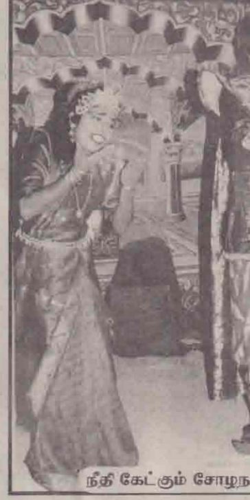
நீதி கேட்டும் சோழநாட்டாள்

கண்டுள்ளமைக்கு, தயாரிப்பாளரான அவரின் கைவண்ணமே காரணம். துல்லியமான - பொருத்தப்பாடுடைய பின்னணி வயலின் இசையுடன் திரை விலகி, ஆரம்பமாகும் இந்நாடகம், ஒரு மணி நேரம் எந்தவிதத்