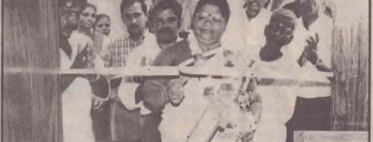
யாழ்ப்பாணம், செப்.30 யாழ்ப்பாணக் கழகம் தனது 20 ஆவது பட்டமளிப்பு விழாவை முன்னிட்டு வருடாந்தம் நடத்தப்படும் நினைவுப் பேருரைகள் எதிர்வரும் 8ஆம் திகதி முதல் மூன்று தினங்களுக்குப் பல்கலைக்கழக கைவாசலில் கலையரங்கில் நடைபெறவுள்ளன.