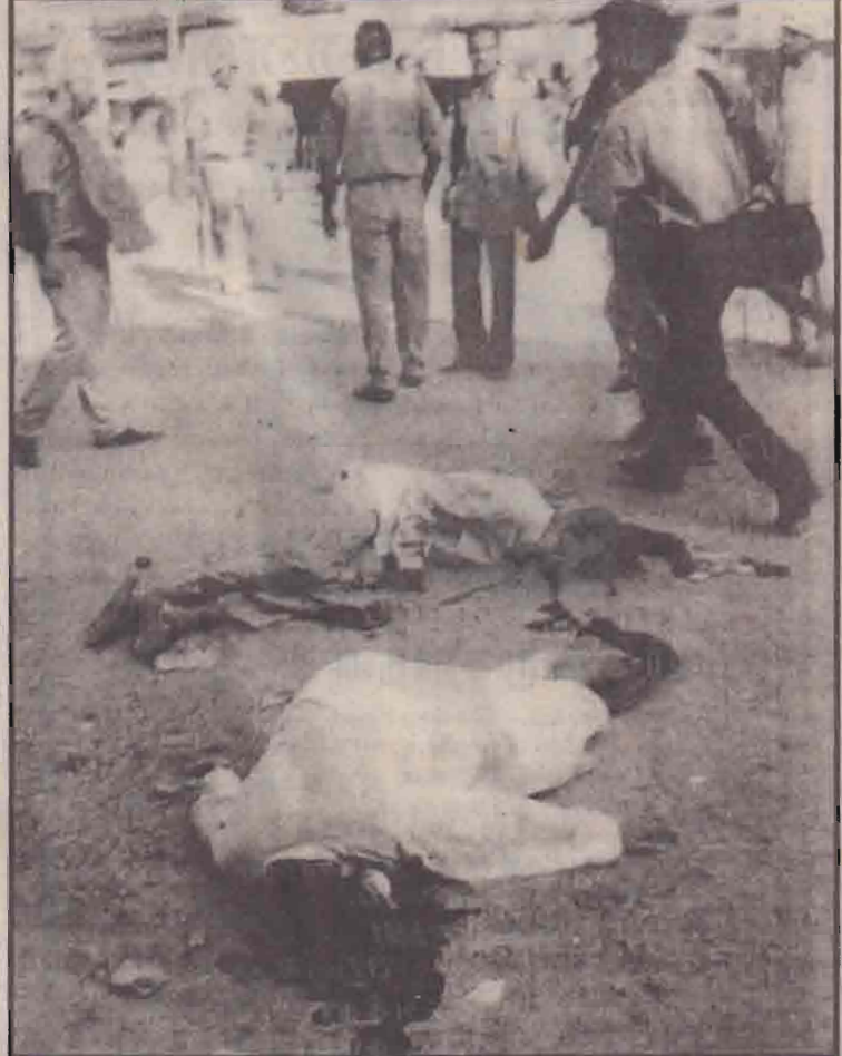
இந்தியாவில் இஸ்லாமிய மாணவர் இயக்கம் தடைசெய்யப்பட்டதை அடுத்து உத்தரபிரதேச மாநிலம் பழைய லக்னோவில் பெரும் வன்முறை வெடித்தது. வன்முறையை அடக்க பொலீஸார் மேற்கொண்ட சூப்பாக்கப் பிரயோகத்தில் சூவர் உயிரிழந்தனர். உயிரிழந்தவர்களில் சிறுவரின் சடலங்கள் வீதியில் கிடப்பதைப் படத்தில் காணலாம்.

இதற்கிடையில் சென்னை உயர் நீதிமன்றத்துக்கு நேற்றுமுன்தினம் வெடிகுண்டு மிரட்டல் விடுக்கப்பட்டது. இதனையடுத்து பொலீஸாரும் வெடிகுண்டு நிபுணர்களும் மோசப நாயக்கர் சகிதம் நீதிமன்ற வளாகத்தில் தேடுதல் நடத்தினர். ஆயினும் வெடிகுண்டுகள் எவையும் அங்கு கண்டுபிடிக்கப்படவில்லை. இதேவேளை, தடைசெய்யப்பட்ட இந்திய இஸ்லாமிய மாணவர் அமைப்பினரால் அசம்பாவிதச் சம்பவங்கள் எதுவும் ஏற்படுத்தப்படவில்லை என்ற அச்சத்தால் நாடு முழுவதும் பலத்த பாதுகாப்பு ஏற்பாடுகள் மேற்கொள்ளப்பட்டுள்ளதாகக் கூறப்படுகிறது.