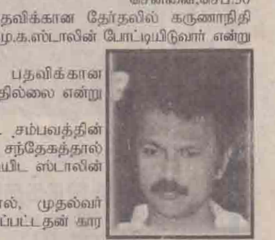
சென்னை மெயர் பதவிக்கான தேர்தலில் கருணாநிதியின் மகனும், சென்னை மெயருமான மு.க.ஸ்டாலின் போட்டியிடுவார் என்று தி.மு.க. அறிவித்துள்ளது.

சென்னை, செப்.30 சென்னை மாநகராட்சி மெயர் பதவிக்கான தேர்தலில் கருணாநிதியின் மகனும், சென்னை மெயருமான மு.க.ஸ்டாலின் போட்டியிடுவார் என்று தி.மு.க. அறிவித்துள்ளது. முன்னதாக சென்னை மெயர் பதவிக்கான தேர்தலில் தான் போட்டியிடப் போவதில்லை என்று மு.க.ஸ்டாலின் கூறிவந்தார். கருணாநிதி கைது செய்யப்பட்ட சம்பவத்தின் பின்னரும், வெற்றி வாய்ப்புக் குறித்த சந்தேகத்தால் மெயர் பதவிக்கான தேர்தலில் போட்டியிட ஸ்டாலின் தயக்கம் காட்டி வந்தார். நற்போது நீதிமன்றத் தீர்ப்பினால், முதல்வர் பதவியிலிருந்து ஜெயலலிதா விலக்கப்பட்டதன் காரணமாகவும் - காங்கிரஸ் தலைமையில் மூன்றாவது அணி தேர்தலில் களம் இறங்கியுள்ளதால், அ.தி.மு.க. கூட்டணியின் வாக்குகள் சிதறும் என்ற நம்பிக்கையாலும் - ஸ்டாலின் மெயர் தேர்தலில் போட்டியிட முன்வந்துள்ளதாகக் கருதப்படுகிறது. (ஏ-7)