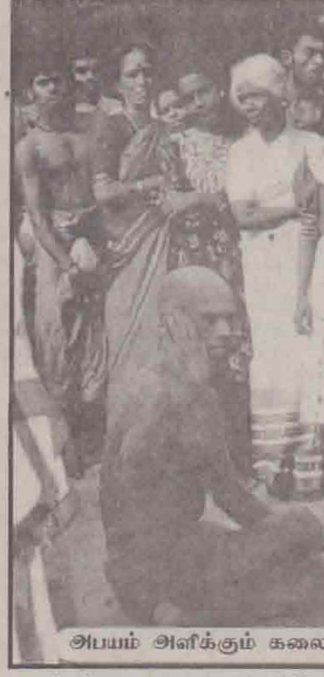
அபயம் அளிக்கும் கலை ஆட்டம்

தொடங்கி விட்டது. "அன்புக்கு அருள்வாய் நீ ஐம்புவனின் அருமருந்தியே அழகனே அருள்வாய் நீ வளர்மதி ஒளி தருவாயே" என்ற பாடல் வரிகள் பக்தி இன்பத்தை தந்து கொண்டிருந்தன. தாளம்