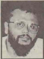
மாண்புமிகு அமைச்சர் கே.என்.டக்ளஸ் தேவானந்தா அவர்களையும்

சுழிபுரம் ஸ்ரீ பத்திரகாளி அம்பாள் ஆலய கட்டடத் திருப்பணிக்காக ரூபா ஒரு லட்சம் ஒதுக்கீடு செய்து உதவியமைக்காக