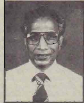
எமது பாடசாலை அதிபர்