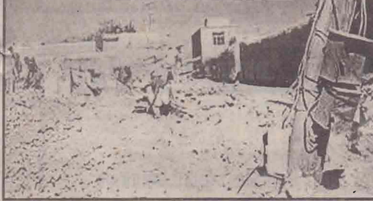
சீதைந்துபோன ஆப்கானியக் கிராமம் ஒன்று.