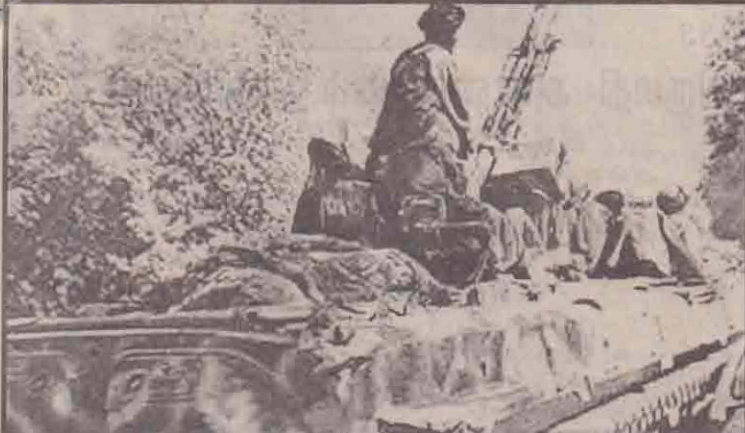
டாங்கியின் மீது விமான எதிர்ப்பு ஏவுகணையுடன் அமெரிக்க விமானங்களை எதிர்த்தோக்கும் தலிபான்கள்.