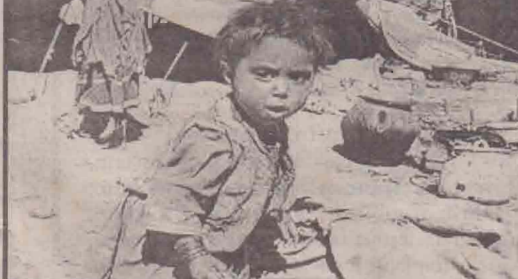
அகதிகளுக்கு விவளியே விளையாடும் குழந்தை.