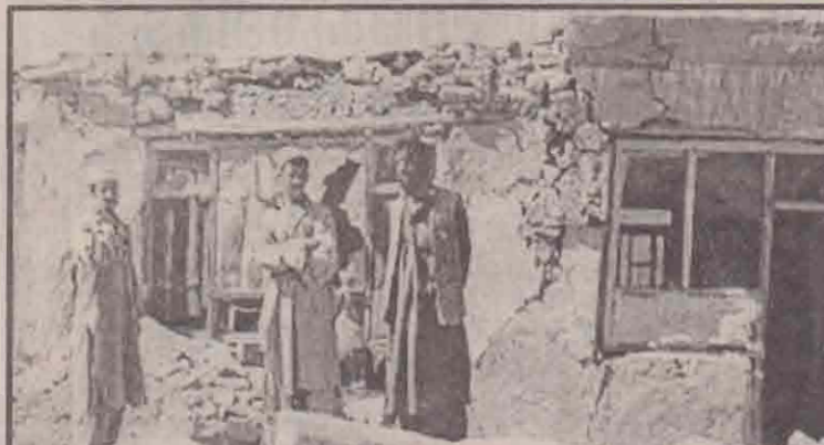
சேதமடைந்த தமது வீட்டைப் பார்வையிடும் ஆப்கானியக் குடும்பம்.