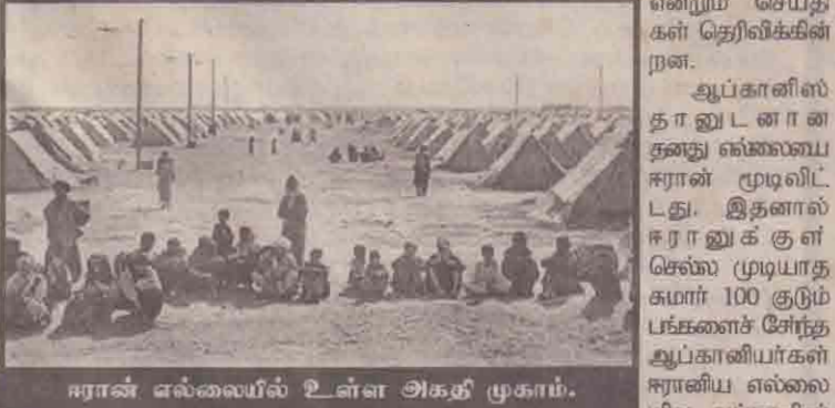
ஈரான் எல்லையில் உள்ள அகதி முகாம்.

தெஹ்ரான், நவ.5 ஆப்கானிஸ்தானுக்குள் ஈரானிய எல்லையோரமாக அமைக்கப்பட்டுள்ள அகதி முகாம்களின் நிலை மிக மோசமாக உள்ளது என அறிவிக்கப்பட்டுள்ளது. அங்குள்ள மக்களுக்கிடையே வாந்தியேதி, எனபுருக்கி நோய் மற்றும் வயிற்றுளைவு ஆகிய நோய்கள் மிக வேகமாகப் பரவி வருகின்றன என்றும் செய்திகள் தெரிவிக்கின்றன.