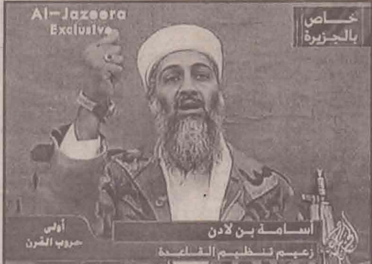
அல் - ஜெஸ்ரா தொலைக்காட்சி மூலம் பின்லேடன் உரையாற்றிய காட்சி. அமெரிக்கா மீது நடத்தப்பட்ட தாக்குதலின் பின் தனது மறைவிடத்தில் இருந்து பின்லேடன் வழங்கிய முன்றாவது தொலைக்காட்சி உரை கிழுவாகும்.

குவைத், நவ.5 அமெரிக்கா தலைமையில் தற்போது நடத்தப்பட்டுவரும் போர், இஸ்லாமியர்களுக்கு எதிரான கிறிஸ்தவர்களின் யுத்தம் என்று சவுதி கோடஸ்வரர் ஓஸாமா பின்லேடன் தெரிவித்திருக்கிறார்.