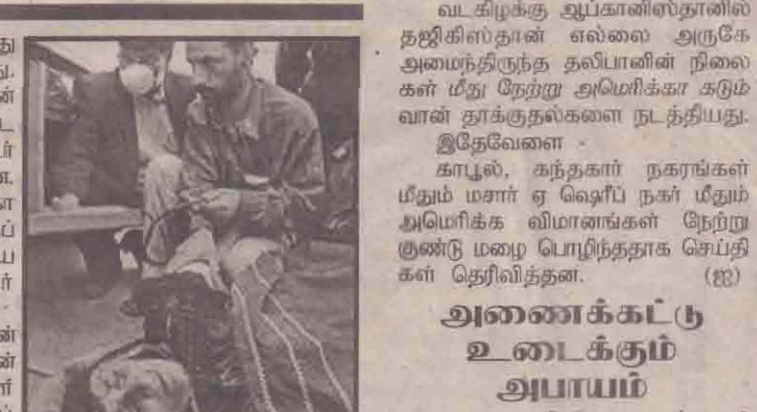
ஆப்கானிய அகதி ஒருவர் மருத்துவ நிலையம் ஒன்றில் சிகிச்சை பெறுகிறார்.