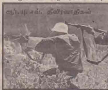
தீவிரவாதக் குழுவின் உறுப்பினர்கள் சிலருக்கு 'அல்கெய்டா' இயக்கத்துடன் தொடர்பு இருப்பதாக 'வாஷிங்ரன் போஸ்ட்' பத்திரிகை தகவல் வெளியிட்டிருக்கிறது.

அமைப்பின் தொடர்பு இருப்பதாகக் கிளப்பப்பட்டிருக்கும் குற்றச்சாட்டை மறுத்துள்ள அந்தத் தீவிரவாதிக் குழு, தங்கள் இயக்க உறுப்பினர் களிடையே உள் விசாரணை ஒன்றைத் தாங்கள் ஆரம்பித்திருப்பதாகத் தெரிவித்திருக்கிறது.