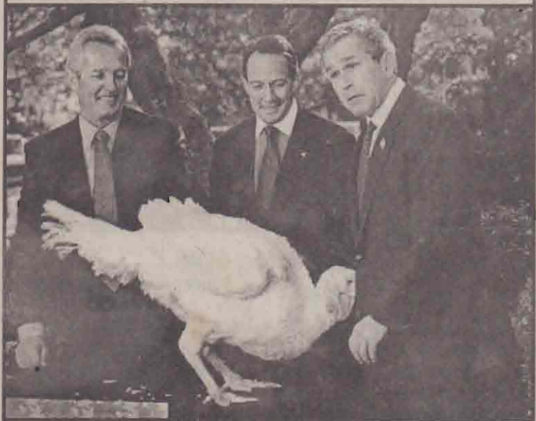
குறும்புத்தனம் மிக்க வான்கோழி ஒன்றின் செயலால் அதிர்ச்சியடைந்த அமெரிக்க அதிர்வுப் படைத்தல் காண்கிறீர்கள். கடந்த திங்கட்கிழமை வெள்ளை மாளிகைத் தோட்டத்தில் கிடம்பெற்ற நகழ்வொன்றில், அங்கு வளரும் இந்த வான்கோழி அதிர்வுப் படைக்கு கிப்படித் தலையை நுழைத்துத் தாம்சங்கடத்தை ஏற்படுத்தவில்லை.