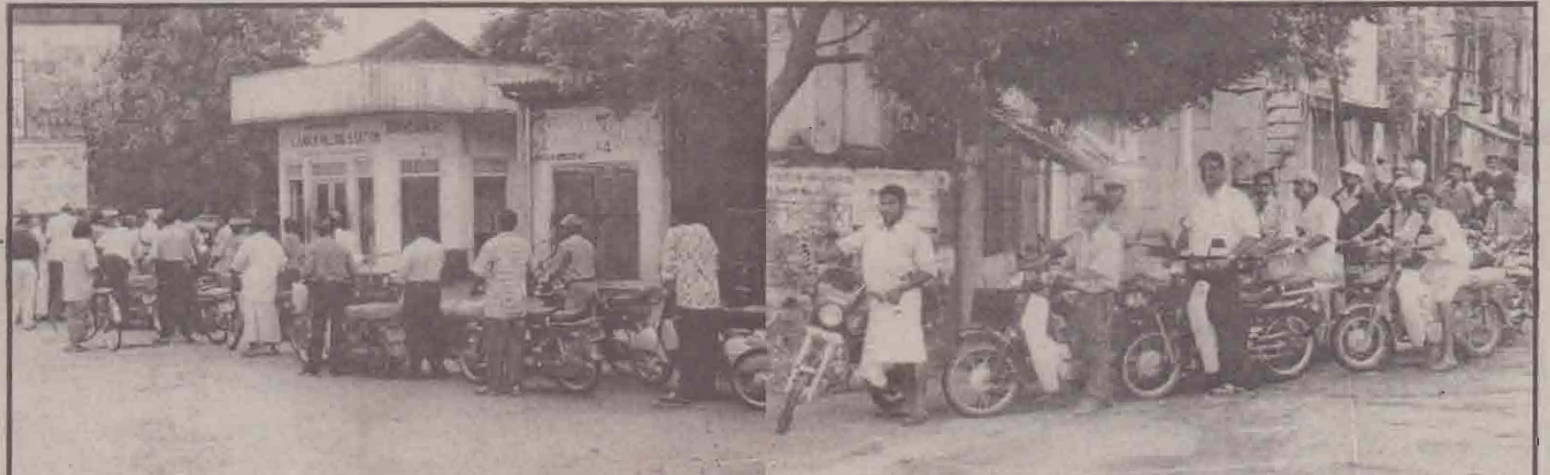
கிது வாக்களிப்பதற்காக வந்த மக்கள் கூட்டம் அல்ல. யாழ்ப்பாணம் உள்ள ஈரிப்பொருள் நிர்ப்பு நிலையம் ஒன்றில் பெற்றோல் பெறுவதற்காக மேட்டார் சைக்கிள்களுடன் காத்திருந்தோரின் நண்ட வரிசையே கிது, குடாநாட்டில் ஈரிப்பொருள்களுக்கான தட்டுப்பாடு நடக்கிறது.

புத்தளம் பகுதியில் வாக்களிப்பு அமைதியாக இடம்பெற்றது. காலை வேளையில் மந்தமாகக் காணப்பட்ட வாக்களிப்பு பகல் வேளையில் கறுசுறுப்பாக நடைபெற்றது. முஸ்லிம் பெண்கள் நோன்பு நேற்றுவாக்களாக நண்ட வரிசைகளில் நின்று வாக்களித்தனர். நேற்று முன்தினம் இரவு ஆனாமருவ பகுதியில் இடம்பெற்ற கைக்குண்டு வீச்சில் பொது மக்கள் ஐக்கிய முன்னணி ஆதரவாளர் மூவர்காயடைந்தனர். புத்தளம் வெளிப்பறவட்ட விதியில் பொது மக்கள் ஐக்கிய முன்னணி ஆதரவாளர் ஒருவரின் வீட்டின் மீது தப்பாக்கிப் பிரயோகம் செய்து இனத்தெரியாத நபர்கள் சுமார் 50 ஆயிரம் ரூபாய் பணத்தையும் கொள்ளையிட்டுச் சென்றனர் என்று தெரிவிக்கப்படுகின்றது. (ஐ)