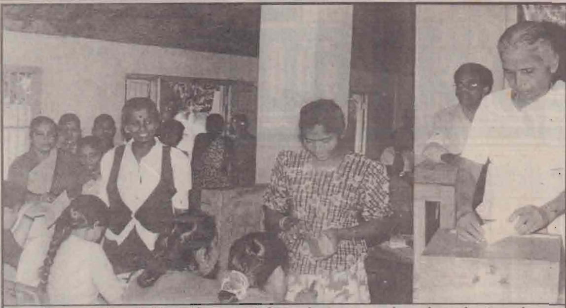
நேற்றைய வாக்களிப்பில் ஆண்களை விடப் பெண்களே சுறுசுறுப்பாகக் கலந்துகொண்டதை அவதானிக்க முடிந்தது. கந்தர்மடம் சைவப்பிரகாச மகா வித்தியாலயத்தில் வாக்களிக்க வந்திருந்த பெண்கள் கூட்டத் தையும் வயோதியப் பெண் ஒருவர் வாக்குப் பெட்டிக்குள் வாக்கைச் செலுத்துவதையும் படங்களில் காணலாம்.