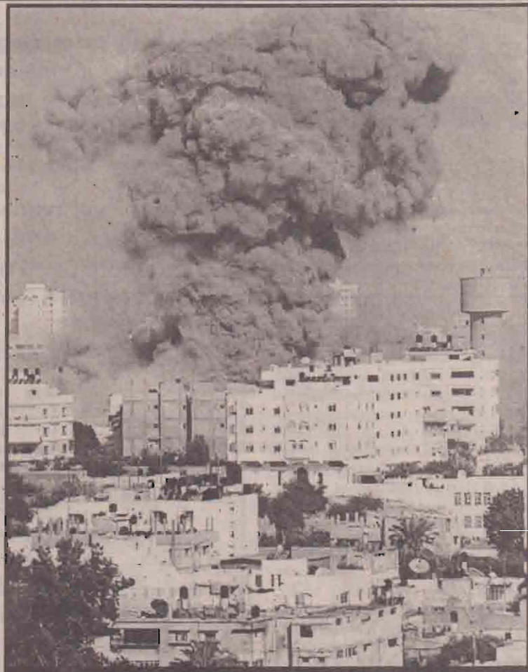
நேற்றுமுன்தினம் காஸாவில் உள்ள பலஸ்தீனப் பாதுகாப்புத் தலைமையகம் மீது இஸ்ரேலிய வான்ப்பட நடத்திய தாக்குதலின் போது புகை மண்டலம் எழுவதைப் படத்தில் காணலாம்.

இஸ்ரேலியக் கட்டுப்பாட்டு நகரான ஐரோசலேமில் நேற்றுக்காலை பலஸ்தீனத் தீவிரவாதியொருவர் தற்கொலைக் குண்டுத் தாக்குதலை நடத்தினார். இதில் ஏராளமானவர்கள் உயிரிழந்திருக்கலாம் என்று அஞ்சப்படுகிறது. மத்திய ஐரோசலேமின் 'ஹெய்டன்' ஹோட்டலின் முன்பாக இருந்த பஸ்தரிப்பு நிலையம் ஒன்றில் தற்கொலைக் குண்டுதாரி தனது உடலில் சுட்டியிருந்த குண்டை வெடிக்க வைத்தார். இதில் பெரும் சேதம் ஏற்பட்டதாக இஸ்ரேலிய வானொலி கூறியது. பஸ்தரிப்பில் நின்று கொண்டிருந்த மூவர் இத்தாக்குதலில் காயமடைந்ததாக சுயாதீனச் செய்திகள் தெரிவித்தன. கடந்த வார இறுதியில் இஸ்ரேலிய நகரங்களில் பலஸ்தீனத் தீவிரவாதிகள் நடத்திய தற்கொலைத் தாக்குதல்களில் 25 பேர் உயிரிழந்ததைத் தவிர்த்து, காஸாவில் பலஸ்தீனத் தலைவர் அரபாத்தின் அலுவலகத்தின் மீது இஸ்ரேல் வான் தாக்குதல் நடத்தியது. அதற்குப் பதிலடியாக தற்போது பலஸ்தீனத் தீவிரவாதிகள் ஐரோசலேமில் தற்கொலைத் தாக்குதல் நடத்தியுள்ளதாகக் கருதப்படுகிறது. இதேவேளை, பலஸ்தீன நிர்வாகம், பலஸ்தீனத் தீவிரவாதிகளுக்கு எதிராக சரியான நடவடிக்கை எடுப்பது உறுதியாகும் வரை தமது தாக்குதல்கள் தொடரும் என்று இஸ்ரேல் அறிவித்துள்ளது. இது தொடர்பாக கருத்துத் தெரிவித்த பலஸ்தீனத் தகவல் தொடர்பு அமைச்சர் யஸீர் அப்து ரப்தோ, மேற்குக்கரை மற்றும் காஸா பகுதிகளை இஸ்ரேல் ஆக்கிரமித்திருப்பதே, பலஸ்தீனத் தீவிரவாதத்துக்குக் காரணம் என்று தெரிவித்தார். கடந்தவார இறுதியில் ஐரோசலேமிலும், காஸாவிலும் பலஸ்தீன ஹமாஸ் தீவிரவாதிகள் நடத்திய தற்கொலைத் தாக்குதல்களையடுத்து பலஸ்தீனத் தலைவர் யஸீர் அரபாத்தின் உத்தரவின் பேரில், தலைவர்கள் உட்பட ஹமாஸ் அமைப்பினர் சுமார் நூறுபேரை பலஸ்தீனப் பொலீஸார் கைதுசெய்தமை குறிப்பிடத்தக்கது. (9-8)