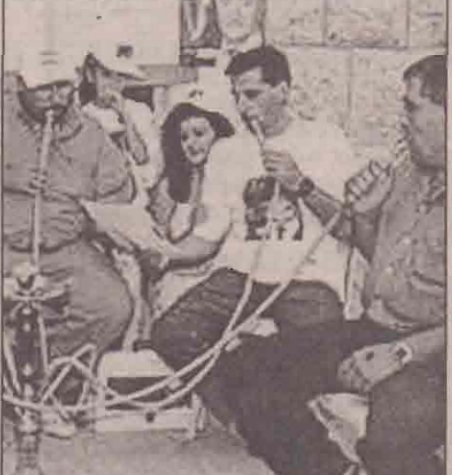
சவுத் அரேபியாவில் குடும்பமொன்றில் புகையிலையை கொளுத்தி, அதிலிருந்து செல்லும் குழாய்கள் மூலம் பலர் புகை பிடிக்கும் காட்சி.