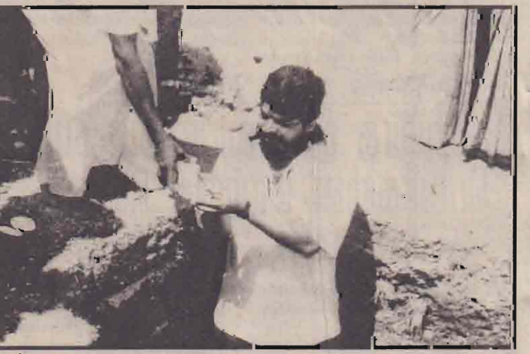
சங்கானை சிவப்பிரகாச மகா வித்தியாலத்தில் கட்டப்படவுள்ள முன்று மாடிக் கட்டடத்துக்கான அடிக்கல் நட்டும் வைபவம் அண்மையில் நடைபெற்றது. வலிமேற்கு பிரதேச சபைத் தலைவர் ந.நிர்மலாநாதன் அடிக்கல்லை நட்டுவைப்பதைப் படத்தில் காணலாம். (க-7-29)