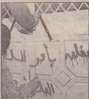
ஹமாஸ் இயக்க சிபுலவகம் பலஸ்தீன அதிகாரிகளால் முட்படுகிறது.

பலஸ்தீன அதிகாரசபையால் கொடுக்கப்பட்ட கரும் அழுத்தங்களை அடுத்த இஸ்ரேலியர்களுக்கு எதிரான தற்கொலைத் தாக்குதல்களை இடைநிறுத்துவதாக ஹமாஸ் இயக்கம் அறிவித்துள்ளது.