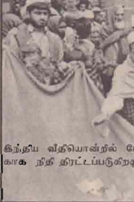
இந்திய வித்யொன்ரில் போருக்காக நிதி திட்டப்படுகிறது.

"எல்லை நெடுகிலும் பாகிஸ்தான் படைகளைக் குவித்து வருகின்றன"