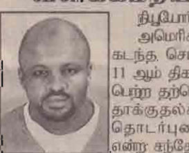
திபுயோங்குடி, டிசெ. 21 அமெரிக்காவில் கடந்த செப்டெம்பர் 11 ஆம் திகதி இடம்பெற்ற தற்கொலைத் தாக்குதல்களுடன் தொடர்புடையவர் என்ற கந்தேகத்தின் பேரில் வேர்ஜினியா நிதியன்றில் பொலீஸாரால் ஆஜர் செய்யப்பட்ட ஒருவர் விளக்கமறியலில் வைக்கப்பட்டுள்ளார்.

நாடாளுமன்றம் மீதான தாக்குதலை அடுத்து இந்தியா, பாகிஸ்தான் மீது இராணுவத் தாக்குதல்களை நடத்தவேண்டும் என்று உள் அமெரிக்க தாக்குதல் சந்தேகநபருக்கு விளக்கமறியல்