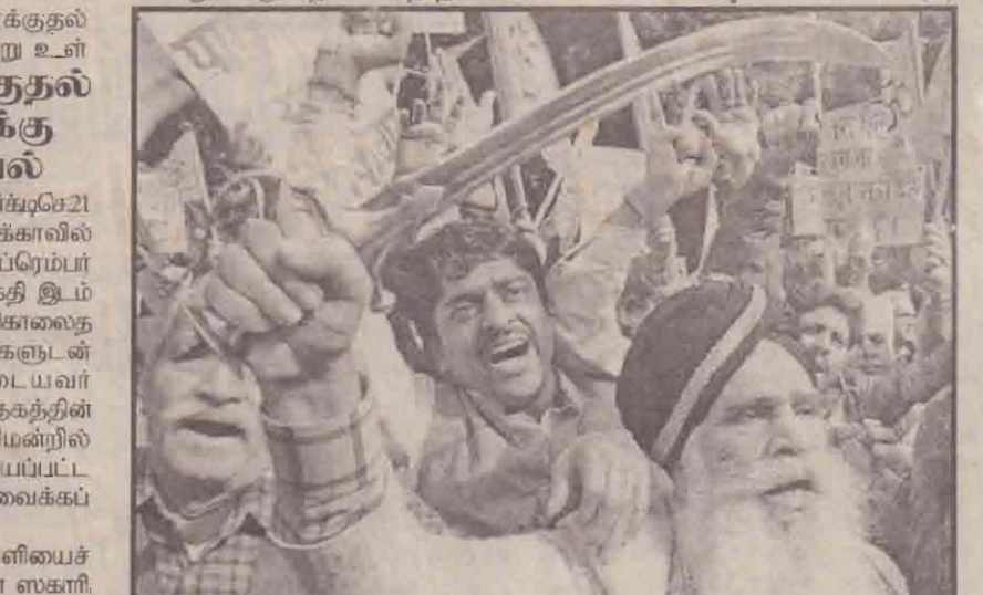
இந்திய நாடாளுமன்றம் மீதான தாக்குதலையடுத்து பாகிஸ்தான் மீது படை நடவடிக்கை எடுக்க வேண்டும் எனக் கோரி வீக்ஷ ஹிந்துப் பரிஷத் அமைப்பினர் புதுடில்லியில் ஆர்ப்பாட்டம் நடத்துகின்றனர்.