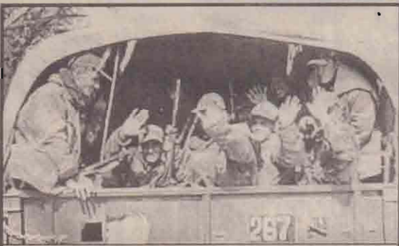
எல்லை நோக்க விரையும் இந்தியப் படையினர்.

இந்திய நாடாளுமன்றத் தினமீது தீவிரவாதிகள் தாக்குதல் நடத்தியதைத் தொடர்ந்து இந்தியா - பாகிஸ்தான் இடையேயான முறுகல் நிலை மேலும் மேலும் அதிகரித்து வருகின்றது. கட்டுப்பாட்டு எல்லைக் கோட்டுக்கு அருகே இருதரப்பும் படைகளைக் குவித்து வருகின்றன. எந்த நேரமும் யுத்தம் மூளலாம் என்ற பதற்றநிலை எல்லையில் நீடிக்கின்றது.