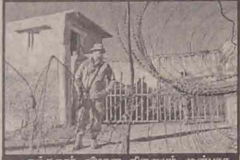
கந்தகார விமான நிலையம் முன்பாக காவல் கடமையில் அமெரிக்கச் சிப்பாய்.

ஆப்கான் செல்லவள்ள இந்தப் பன்னாட்டுப் படைகள் இறுதி செய்யப் பட்டுவிட்டன. இந்தப் படையணியில் பிரான்ஸ், ஜேர்மனி, ஸ்பெயின், ஆர்ஜென்டீனா, இத்தாலி, நியூ சிலாந்து, கனடா, துருக்கி, ஜேர்மான், மலேஷியா ஆகிய நாடுகளைச் சேர்ந்த படையினர் பிரிட்டனின் தலைமையில் செயற்படுவர்.