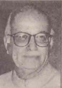
இதற்கு ஆதாரமாக ஜம்மு - காஷ்மீரின் பயங்கரவாதத்துக்குத் துணை போவதை நிறுத்தி இந்தியாவால் தேடப்பட்டுவரும் தாஷுத் இப்ராஹிம் உட்பட அனைத்துத் தீவிரவாதிகளையும் ஒப்படைக்க வேண்டும் என்றார். இதற்கிடையில் -

இந்திய நாடாளுமன்றம் மீதான தாக்குதலுக்காக பாகிஸ்தானுக்குப் பதிஷ்டு கோடுக்குக் விடயத்தில் இந்திய அரசு அளசரப்பட்டுச் செயற்படாது என்று இந்திய உள்துறை அமைச்சர் எல்.கே.அத்வானி நாடாளுமன்றத்தில் உறுதியளித்துள்ளார்.