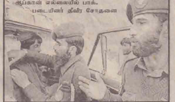
ஆப்கான் எல்லையில் பாகிஸ்தானியப் படையினர் தீவிர சோதனை

அல்கெய்டா உறுப்பினர்கள் கைது செய்யப்பட்டதை அமெரிக்கப் பாதுகாப்புச் செயலர் ரொனால்ட் ட்ரம்ஸ் பீல்ட் வரவேற்றுள்ளார். "பாகிஸ்தானியப் படையினர் மிகநல்ல காரியத்தைச் செய்திருக்கின்றார்கள்" என்றார் அவர். (ம)