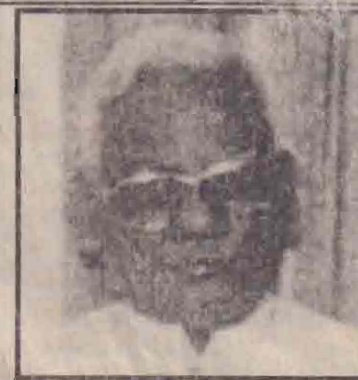
ஜனநாயக அரசியலில் ஒரு கட்சி வெல்வதும் மற்றது தோற்பதும் தவிர்க்க முடியாதது. தேர்தல் முடிந்தவுடன்தான் அதை

கடந்த பொதுத் தேர்தலில் பொ.ஐ.மு. முன்னணிக்கு ஏற்பட்ட தோல்விக்கு எமது வருத்தத்தைத் தெரிவிக்கின்றோம்.