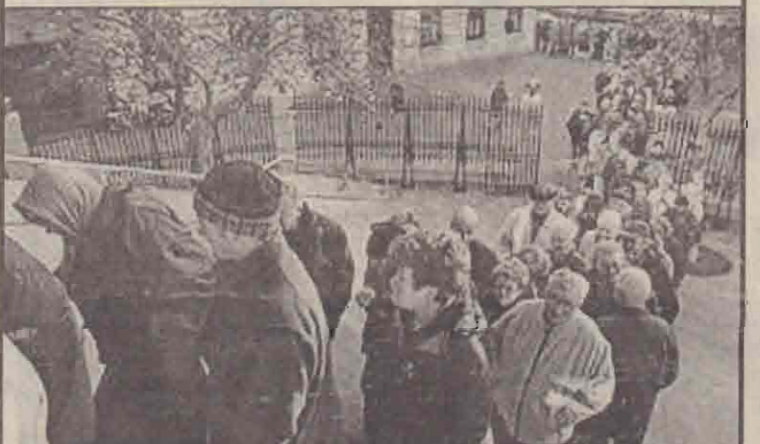
அயர்லாந்தின் டப்லின் நகர் மத்திய வங்கியில் யூரோ நாணயத்தைப் பெற்றுக்கொள்ள காத்திருப்பவர்கள்.