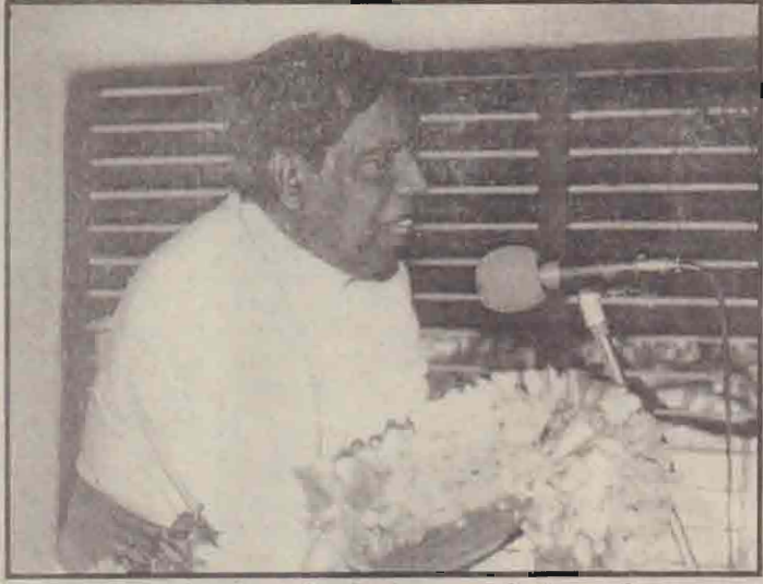
தென்னிந்தியத் திருச்சபையின் பேராயர்