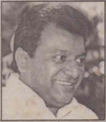
கொழும்பு, ஜன.3 அரசுக்கும் விடுதலைப் புலிகளுக்கும் இடையிலான சமாதானப் பேச்சுக்கு நோர்வே அரசு தொடர்ந்து

கட.17 வள்ளுவர் ஆண்டு 2032 மங்கழி 19 வியாழக்கிழமை (03-01-2002) UTHAYAN - A Lively National Tamil Daily கதிர்:39