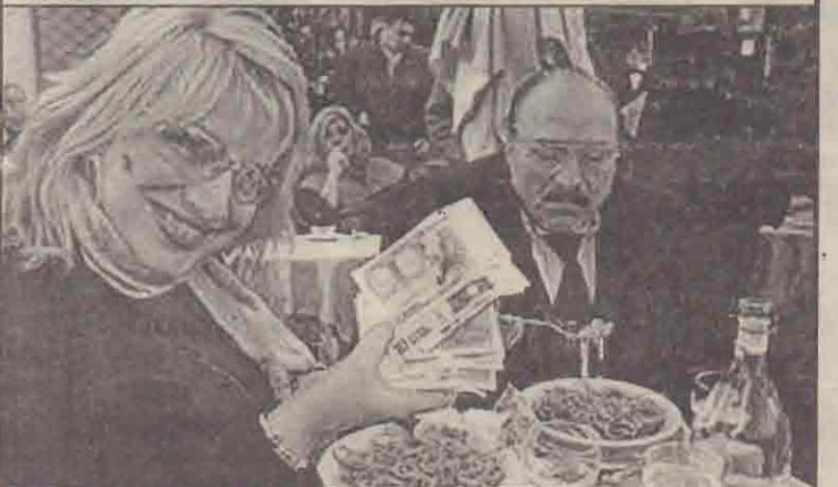
கிரேக்கத் தலைநகர் ரோமில் புதிய யூரோ நாணயத்தை மகிழ்வுடன் வாங்கும் உணவக உரிமையாளர் ஒருவர்.