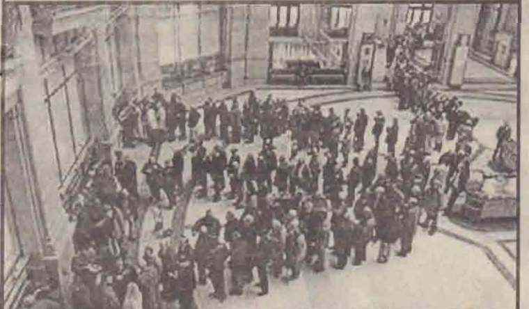
ஸ்பெயின் தலைநகர் மட்டிரிடின் வங்கி ஒன்றில் யூரோ நாணயத்தைப் பெற்றுக்கொள்ள நின்ற மக்களின் நீண்ட வரிசை.

'யூரோ' சில்லறை குற்ற நாணயங்கள் - 1 யூரோ, 2 யூரோ மற்றும் 1 யூரோ சதம், 2 யூரோ சதம், 5 யூரோ சதம், 10 யூரோ சதம், 20 யூரோ சதம், 50 யூரோ சதம் எனவும் - யூரோ பண நோட்டுகள் - 5 யூரோ, 10 யூரோ, 20 யூரோ, 50 யூரோ, 100 யூரோ, 200 யூரோ, 500 யூரோ எனவும் - மதிப்புக் கொண்டவைகளாக வெளியிடப்பட்டுள்ளன.