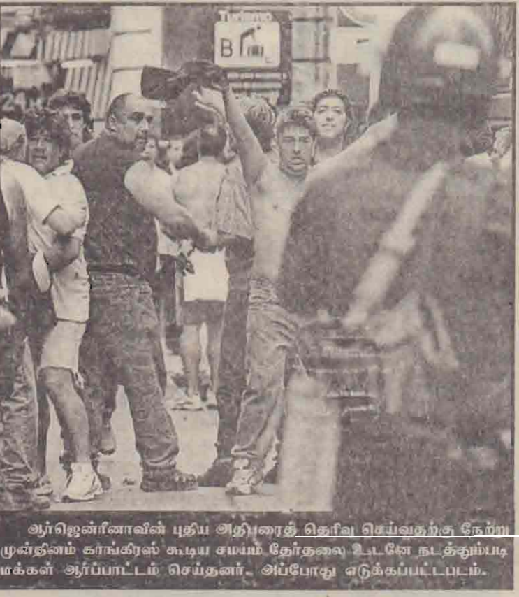
ஆர்ஜென்னைவின் புதிய அதிபரைத் தெரிவு செய்வதற்கு கோரி முன்னம் காங்கிரஸ் கூடிய சமயம் தேர்தலை உடனே நடத்துமாறு மக்கள் அர்ப்பாட்டம் செய்தனர். அப்போது எடுக்கப்பட்ட படம்.

இதனையடுத்து அதிபர் பெர்னானடோ டிராருவா கடந்த டிசெம்பர் 20 ஆம் திகதி பதவி விலகினார். அதற்குப்பின் கடந்த இரு வாரங்களில் வேறு மூவர் அடுத்தடுத்து அதிபராக அறிவிக்கப்பட்டனர். ஆனால் அவர்கள் எவரும் அதிபர் பதவியில் தாக்குப் பிடிக்கவில்லை. தற்போது 5ஆவது நபராக டகல்டே அதிபராகப் பதவியேற்றுள்ளார். (ஏ)