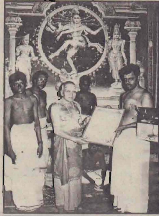
காரைநகர் ஈழத்துச் சீதம்பரத்தில் மணிவாசகர் சபையினரால் இரங்கலாகார அலங்காரம் செய்து வைக்கப்பட்டது. (க-3-117)

எதிர்வரும் 7ஆம் திகதிவரை இருவரையும் விளக்கமறியலில் வைக்கும்படி நீதிவான் உத்தரவிட்டார்.