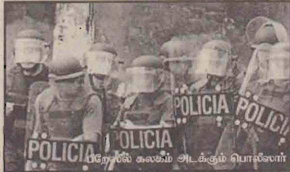
பிரேஸில் கலகம் அடக்கும் பொலீஸார்

சிறைச்சாலையிலேயே இந்தக் கலகம் இடம்பெற்றது. கடந்த சில ஆண்டுகளில் பிரேஸில் இடம்பெற்ற மிகப்பெரும் வன்முறை இது என பி.பி.ஸி. விவரித்தது.