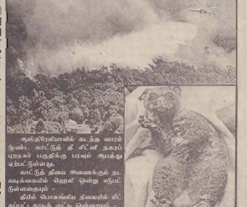
அஸ்தரேலியாவில் கடந்த வாரம் முண்ட காட்டுத் தீ சீடன் நகரப் புறநகர் பகுதிக்கு பரவும் ஆயுதம் ஏற்பட்டுள்ளது. காட்டுத் தீயை அணைக்கும் நடவடிக்கையில் வெறல ஒன்று ஈடுபட்டுள்ளதையும் - தீயில் வாகனங்கள் நலையல் மீட்கப்பட்ட கரடிக் குட்டி ஒன்றையும் - படங்களில் காணலாம்.

எலியின் வருகை குறித்து பலஸ்தீன மற்றும் இஸ்ரேலியத் தரப்புகள் மீதான ஆர்வத்தின் இருக்கின்றன. "நாங்கள் எலியின் வருகை குறித்து எதிர்பார்ப்புடன் இருக்கின்றோம். இப்பொழுது நமது சரியான திசையில் செல்கின்றோம். சமாதான முயற்சிகள் அதற்குரிய துத்துக்கு வந்துள்ளன" - என்றார் பலஸ்தீனத் தலைவர் யஸீர் அராபாத். (ம)