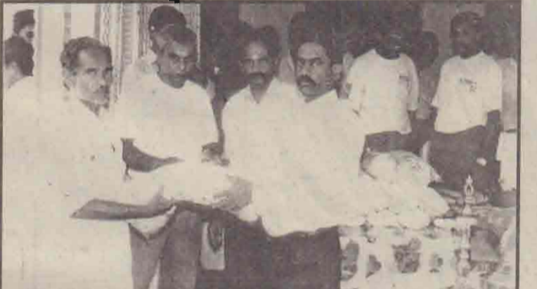
பட்டினக்கு எதிரான நிறுவனம் வடமராட்சி கிழக்கு, பனை பிரதேசங்களின் கடற்பொருளாளர்களுக்கு தலா 5ஆயிரம் ரூபா பெறுமதியான வலை உபகரணங்களை கிவவசமாக வழங்கியது.