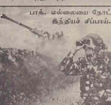
பாக். எல்லை நோட்டமிடும் இந்தியச் சிப்பாய்.

டிசெம்பர் 13ஆம் திகதி இந்திய நாடாளுமன்றத்தில் இடம்பெற்ற தீவிரவாதத் தாக்குதலை அடுத்து காஷ்மீர் தீவிரவாதிகள் மீது நடவடிக்கை எடுக்குமாறு உலக நாடுகள் பாகிஸ்தான் மீது கடும் அழுத்தங்களைப் பிரயோகித்து வந்தன.