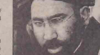
முல்லா அப்துல்சலம் சயீப்

ஆப்கானில் தலிபான்கள் விரட் டப்பட்டு, புதிய ஆட்சி ஏற்படுத்தப் பட்டபின்னர் சயீப் பாகிஸ்தானில்