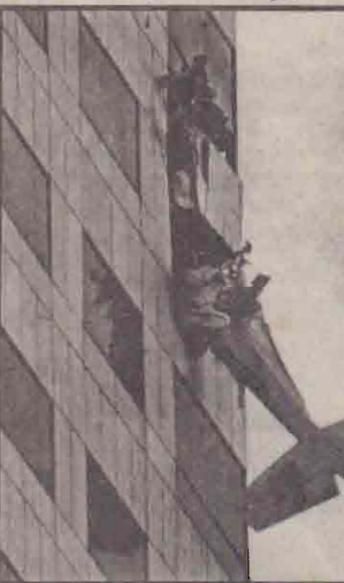
அமெரிக்கன் வங்கிக் கட்டடத்தின் மீது மோதிய விமானத்தின் வால் பகுதி ஜின்சலில் சிக்கித் தொங்குகிறது.