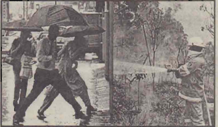
சிட்னி மழையில் செல்பவர்கள் காட்டுத் தீயை அணைப்பவர்

கடந்த சில நாட்களாக மழை பெய்தபோதும் சிட்னி நகரைச் சூழ்ந்த காட்டுத்தீ அபாயம் முற்றாக நீங்கவில்லை. தெற்கு ஆஸ்திரேலியப் பகுதியில் கடந்த கிறிஸ்துமஸ் தினத்தன்று மூண்ட காட்டுத் தீ, சிட்னி நகருக்கும் பரவி பல வீடுகளை எரித்தது.