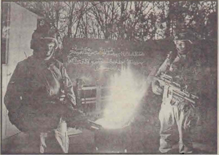
ஆப்கானிஸ்தானில் குளர் காபூல் அமெரிக்க வீரர்கள்

ஜலாலபாத் நகருக்குத் தெற்காக கடந்த சனிக்கிழமை தாக்குதலை தொடங்கிய அமெரிக்கப் படையினர், கிழக்கு ஆப்கானிஸ்தான் தாக்குதல்களை ஆரம்பித்துள்ளனர். ஆயினும் அல்கெய்டா தலைவர் ஒஸாமா பின்லேடனோ, தலிபான் தலைவர் முல்லா முஹம்மட் ஒமரோ எங்கிருக்கிறார்கள் என்ற சிறு அறி குறி கூட இதுவரை அமெரிக்கப் படையினருக்குத் தெரியவில்லை என்பது குறிப்பிடத்தக்கது. (ஏ-1)