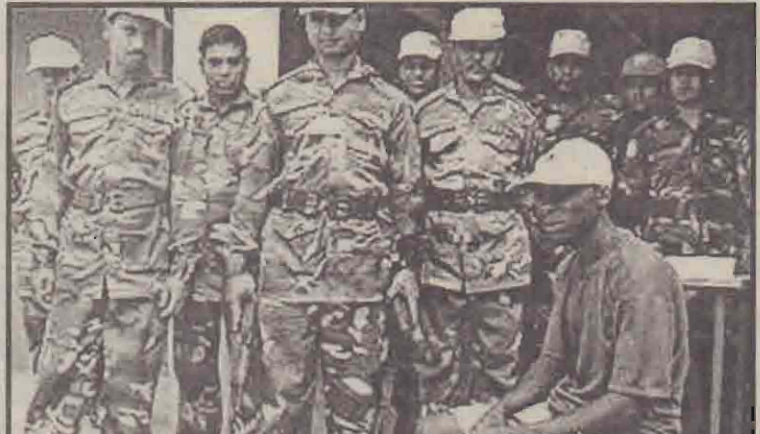
அமெரிக்க நாடான சியாராலியோனில் பத்தாண்டு கால உள்நாட்டுப் போரை முடிவுக்குக் கொண்டுவந்த ஐ.நா. அங்கு தனது அமைதிப்படையைய கண்காணிப்புப் பணியில் ஈடுபடுத்தியுள்ளது.

உலகில் இதுவரை மேற்கொள்ளப்பட்ட அமைதிப்படை நடவடிக்கைகளில் பெரியதும், அதிக உயிர் மற்றும் பொருள் இழப்புக்களைக் கொண்டதமான சியாராலியோனில் ஐ.நா. அமைதிப்படை நடவடிக்கை கருதப்படுவது குறிப்பிடத்தக்கது. (ஏ)