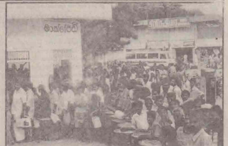
குடாநாட்டில் மண்எண்ணெய்த் தட்டுப்பாடு தொடர்ச்சியாக உள்ளதால் பொருள் நிலையங்களில் மக்கள் எண்ணெய்ப் பரக்களுடன் மண்எண்ணெய் பெறுவதற்காக முண்டியடித்து வருகின்றனர். யாழ். நகரின் மத்தியில் உள்ள எரிபொருள் நிலையம் ஒன்றில் நேற்றுத் தரண்டு காணப்பட்ட மக்களில் ஒரு பகுதியினரையே கிங்கு காண்கிறீர்கள்.