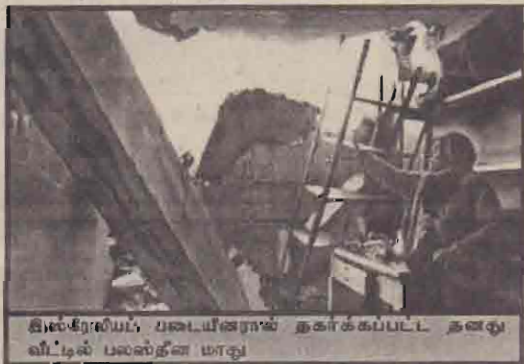
இஸ்ரேலியப் படையினரால் தாக்கப்பட்ட களஞ்சியத்தில் பலஸ்தீன மாது

பலஸ்தீனர்கள் நிலைமையை மேலும் மோசமாக்கிக் கொண்டிருந்தால், இத்தகைய தாக்குதல்கள் தொட