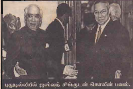
புதுடில்லியில் ஜஸ்வந்த் சிங்குடன் கொலின் பவல்.

புதுடில்லி, ஜன. 19 இந்தியாவுக்கும் பாகிஸ்தானுக்கும் இடையிலான ரயில் மற்றும் பஸ் போக்குவரத்துக்களை மீண்டும் ஆரம்பிக்கும்படி பாகிஸ்தானுடனான இராஜிய உறவுகளை மீண்டும் கட்டியெழுப்பும்படி, இந்தியாவுக்கு விஜயம் மேற்கொண்டுள்ள அமெரிக்க வெளிவிவகாரத்துறைச் செயலாளர் கொலின் பவல் வலியுறுத்தியுள்ளார்.