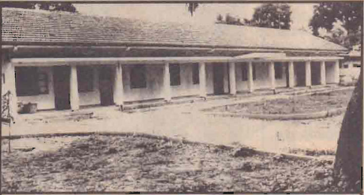
ஒய்வுபெற்ற அருட்தந்தையர்களுக்கான கில்லம் ஒன்று யாழ். பிரதான வீதியில் நிறுவப்பட்டுள்ளது. அந்த கில்லத்தின் தோற்றத்தையே படத்தில் காண்கிறீர்கள்.