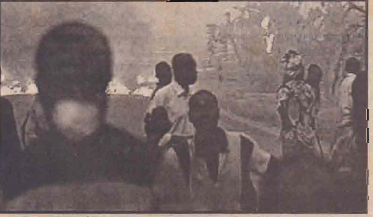
கொங்கோவில் வெடிக்கும் எரிமலையிலிருந்து வெளிக்கிளம்பும் எரிமலைக் குழம்பு பறந்து வந்து கிராமப் பகுதிகளில் வீழ்ந்து வரிகிறது. கிதனையடுத்து கிராமவாசிகள் அச்சம் காரணமாக பாதுகாப்பான இடங்களைத் தேடி ஓடுகிறார்கள்.

எரிமலைக் குழம்பு கோயா நகரின் விமான நிலையத்தினுள்ளும் வீழ்ந்து வருவதால் அங்கிருந்த சகல விமானங்களையும் வெளியேறாமாறு அதிகாரிகள் உத்தரவிட்டுள்ளனர். எரிமலை வெடித்ததனால் 4 லட்சத்துக்கு மேற்பட்ட மக்கள் தமது இருப்பிடங்களைவிட்டு வெளியேறியுள்ளனர். (ம)