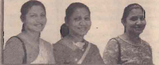
பயலாஜ் - எனது கைஉதவியாளன்