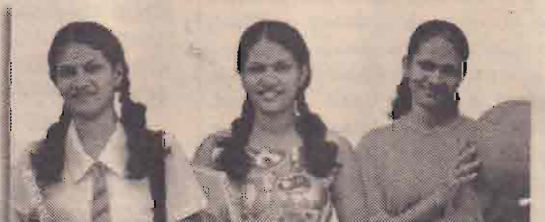
பயலாஜ் - எனது மூத்தவன்