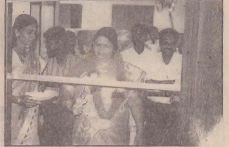
வடக்குக் கிழக்கு மாகாண கிராம அபிவிருத்திக் திணைக்களத்தின் சாரணையுடன் நடத்தப்படும் உள்காவற்றறை பிரதேச செயலக மகஜரில் பாய்ச் நிலைய திறப்புவிழா கடந்த சனிக்கிழமை காணப்படும் பெற்றது.