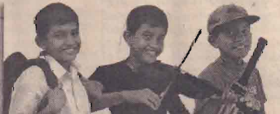
பயலாஜ் - எனது காவலன்

வீட்டில் ஒவ்வொருவருக்கும் ஒவ்வொரு விதமான பயணங்கள் உண்டு. அந்த போக்கு வரத்துக்காக வீணாகும் செலவையும், நேரத்தையும், களைப்பையும் குறைப்பதற்கும், அந்த செலவழியும் பணத்தையும் காலத்தையும் சேமித்து அதை எங்களின் குடும்ப முன்னேற்றத்துக்காக பயன்படுத்த எங்களின் பயலாஜ் வண்டி. மின்னால்தான் உதவ முடிந்தது. பயலாஜ் முச்சக்கர வண்டி அன்றுபோல் இன்றும், இன்றுபோல் நாளையும் எங்களின் முன்னேற்றத்துக்கு கைகொடுத்து உதவ எங்களுடன் தொடர்ந்து நியுயர்லும் என்பது எங்களின் விசுவாசம்.