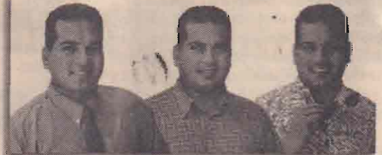
பயலாஜ் - எனது நண்பன்