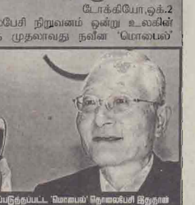
அறிமுகப்படுத்தப்பட்ட 'மொபைல்' தொலைபேசி இறுதாம்

டோக்கியோ, ஒக்ட.2 ஜப்பானின் முன்னணித் தொலைபேசி நிறுவனம் ஒன்று உலகின் மூன்றாம் தலைமுறையைச் சேர்ந்த முதலாவது நவீன 'மொபைல்' தொலைபேசியை நேற்று அறிமுகம் செய்துவைத்தது. ஜப்பான் தலைநகர் டோக்கியோவில் தேர்ந்தெடுக்கப்பட்ட நேற்று இடங்களில் 'கீஜி தசிஹா' என்ற இந்த வகைத் தொலைபேசிகள் என்.ரி.சி. ரூகோமோ நிறுவனத்தால் சேவைக்கு அறிமுகப்படுத்தப்பட்டது. இந்தத் தொலைபேசியைப் பயன்படுத்துபவர்கள் அதன்மூலம் 'இன்ரநெட்' தொடர்புகளை ஏற்படுத்தி தொலைபேசியிலேயே இணையப் பக்கங்களைப் பார்வையிட முடியும்.