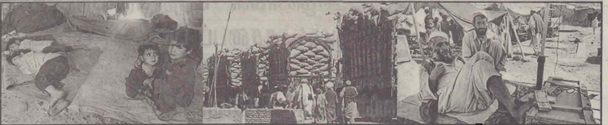
அமெரிக்காவின் தாக்குதலுக்கு இலக்காகக்கூடும் என எதிர்பார்க்கப்படும் ஆப்கானிஸ்தானிலிருந்து வெளியேறிய பாகிஸ்தானிலுள்ள குவாடா அகதிகள் முகாமில் தங்கியுள்ள ஆப்கானிஸ்தான் அகதீச்சிறுவர்களையும், ஆப்கானிஸ்தானின் வடக்குக் கூட்டணியின் கட்டுப்பாட்டில் உள்ள பகுதிகளுக்கு உணவுப் பொருள்களைக் கொண்டுசெல்லும் ஐ.நா. லொறிகளையும், ஆப்கன் - பாகிஸ்தான் எல்லையில் பாகிஸ்தானுக்குள் நுழையக் காத்திருக்கும் அகதிகளுக்கு பணம் மாற்றிக்கொடுப்பதற்காக அங்கு சிற்தாகத் தொழில் ஒன்றை ஆரம்பித்திருக்கும் பாகிஸ்தானியரொருவரையும் படங்களில் காணலாம்.