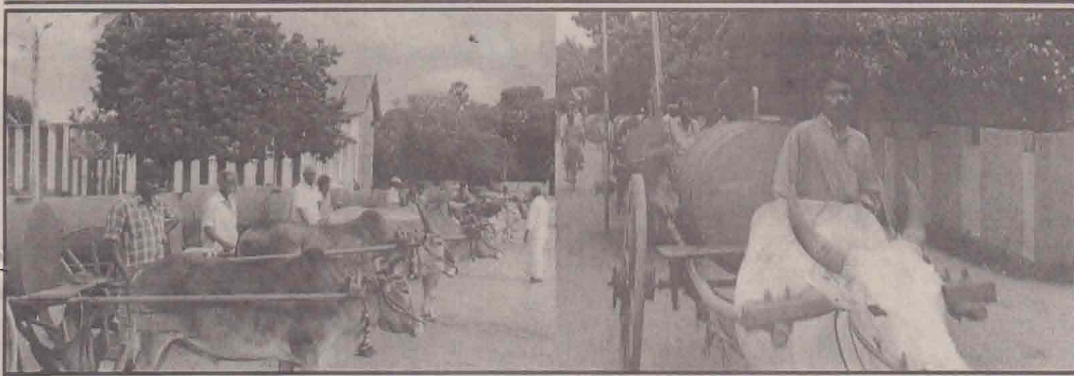
மாட்டுவண்டிகள் மூலம் எரிபொருள் விற்பனை நேற்றுமுன்தினம் நடத்திய பேரணியின்போது எடுக்கப்பட்ட படங்கள். பேரணியாகப் புறப்பட ஆயத்தமாக நல்லூர் கந்தசுவாமி கோயில் முன்றலில் மாட்டுவண்டிகள் வரிசையாக நிற்பதைப் புகழ் படத்திலும் யாழ்.செயலகம்நோக்கி அணிவகுத்துச் செல்வதை அடுத்துள்ள படத்திலும் காணலாம்.

கௌரவிப்பு நிகழ்வு தென்மராட்சி, ஜன.23 கட்டைவேலி நெல்லியடி ப.தேரா. கூ. சங்கத்தின் புலமைப் பரிசில் திட்டத்திற்கு நிதி உதவி வழங்கியவர்கள் கௌரவிப்பும், கடந்த வருடம் நடைபெற்ற ஐந்தாம் தர புலமைப் பரிசில் பரிட்சை, ஜி.சி.ச. உயர்தரப் பரிட்சை ஆகியவற்றில் சித்திபெற்ற மாணவர்களுக்கு புலமைப் பரிசில் வழங்கலும் எதிர்வரும் 27ஆம் திகதி நெல்லியடி மத்திய மகா வித்தியாலயத்தில் நடைபெறும். சங்கத் தலைவர் தலைமையில் நடைபெறும் இந்நிகழ்வில் முதன்மை விருந்தினராக யாழ்.மா.வட்ட உதவி கூட்டுறவு அபிவிருத்தி ஆணையாளர் செ.கனகசபாதி கலந்துகொள்வார். (க-117)