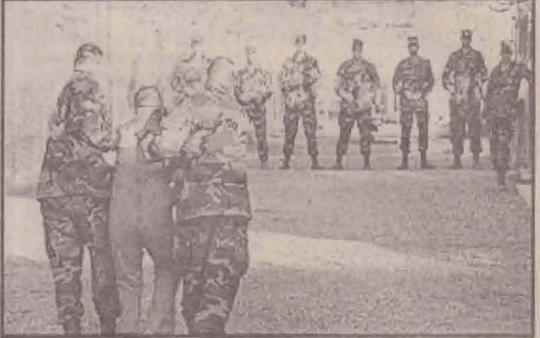
குவாண்டனாமா தளத்தில் தலிபான் கைதவியாருவரை கிழக்குச் செல்லும் அமெரிக்கப் படையினரைப் படத்தில் காணலாம்.

சாட்டை இந்தியா வன்மையாக மறுத்துள்ளது. தாம் அனுப்பிய கோதுமை இன்னமும் பாகிஸ்தானுக்குள் செல்லாத நிலையில் அதற்குறி அந்த நாடு குற்றச்சாட்டுத் தெரிவித்திருப்பது விமர்சனப்பதாக இந்திய அதி காரிகள் தெரிவித்தனர். (ஒ-1)