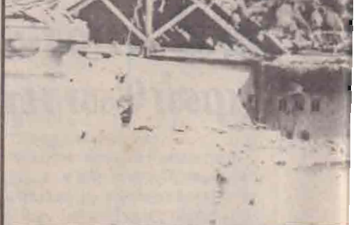
1987 மே 27ஆம் திகதி நடந்த அடிக்கல் போட்டி

ஈழத்துச் சைவ சமய வரலாற்றில் சிறப்புகுரிய அக்கோயில் தனக்கேயுரிய பல சிறப்பம்சங்களைக் கொண்டதாக ஏனைய கோயில்களைப் போலல்லாத தனது பரிவாரக் கோபுரம் கொண்டமைத்திருக்கும் சிறப்புவாய்ந்ததாகும். வண்ணை வைத்தீஸ்வரன் கோயில், வண்ணை மேற்கிவள்ளுள்ள