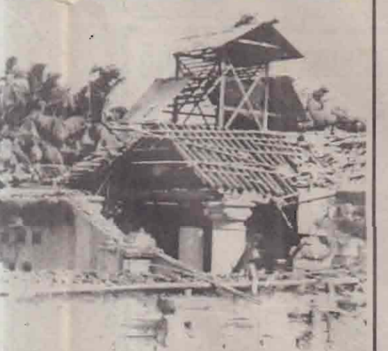
நடத்தப்பட்ட குண்டுத் தாக்குதல் ந்த ஆலயத்தின் தோற்றம்

பிரதிஷ்டா பிரதம குரு பிரதிஷ்டா சேனம்மன், சோ.இ.பிரணதார்த்தினரக் குருக்கள் (வண்ணமேற்கில்)